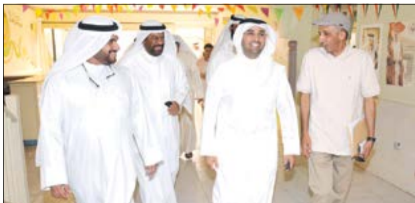
د. نايف الحجرف خلال جولته في مدارس التربية الخاصة وبرفقتة قيادات «التربية»

الحجرف: قرار التقاعد سيشمل جميع الكوادر وتعديل الدوام يجب أن يخضع لدراسات دقيقة 04