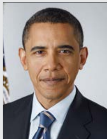
الرئيس الأميركي باراك أوباما

أكدت مصادر حكومية مطلعة ان اللجان المختصة في مجلس الوزراء تعكف حالياً على إعداد البرنامج الحكومي المزمع تقديمه الى مجلس الأمة قبيل افتتاح دور الانعقاد المقبل. وأشارت المصادر خلال حديثها لـ «الأنباء» الى ان الحكومة واستناداً الى مواد الدستور ستلتزم بتقديم برنامج عملها خلال المدة الممنوحة لها وقبل بداية دور الانعقاد في نهاية أكتوبر المقبل. وأوضحت المصادر ناتاً ان البرنامج سيشمل عدة بنود تقع ضمن أهداف عامة رئيسية بما يتوافق مع الخطة الإنمائية للدولة والموازنة العامة، مبينة أن مجلس الوزراء خاطب الوزارات المعنية بإعداد برنامج عملها على أن تقدم خلال الأسابيع المقبلة وقبل شهر أكتوبر حتى يتسنى مراجعتها من قبل اللجنة القانونية تهيئاً لتقديمها الى مجلس الأمة. وكشفت المصادر أن مجلس الوزراء حرص على أن تكون هناك ستة أهداف إستراتيجية للبرنامج، وهي التنمية وزيادة الناتج المحلي ومنح القطاع الخاص الدور الفعال ودعم التنمية البشرية وتكريس الإدارة الحكومية الفعالة والتعليم. وأضافت ان الحكومة برئيس وزرائها والوزراء حريصون على أن تكون البداية موفقة مع مجلس الأمة وستكون هناك اجتماعات تحضيرية مع مكتب المجلس قبيل تقديم