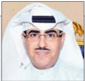
الشيخ فهد المبارك

Spain - Reviving its passion for life 20