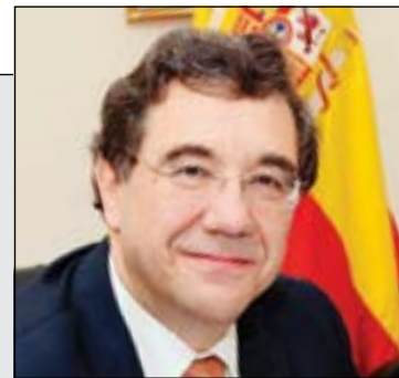
Angel Losada, ambassador of the Kingdom of Spain

Spain - Reviving its passion for life 20