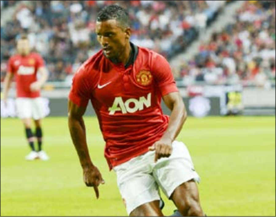
ناني باق مع الشياطين الحمر إلى 2018