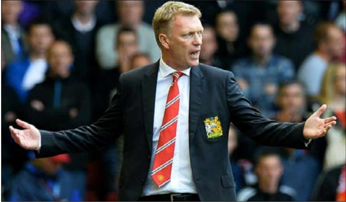
ديفيد مويس ثال اشادة لاعبه الهولندي روبن فان بيرسي

مباريات. وسبق لمويس الاسكتلندي على غرار فيرغسون ان درب 10 اعوام في ايفرتون قبل ان ينتقل الصيف الماضي الي مانشستر يونايتد الذي حقق معه 4 نقاط حتى الآن في 3 مباريات ضمن الدوري المحلي.