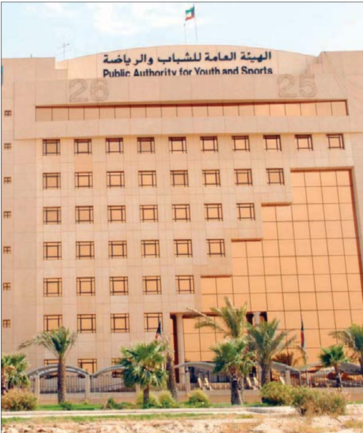
آمال كبيرة في أن يكون الفصل بين قطاعي الشباب والرياضة خطوة مهمة لاحتواء الشباب