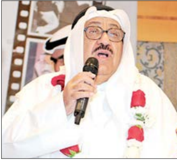
شادي الخليج يلقي كلمة في حفل «الانباء»