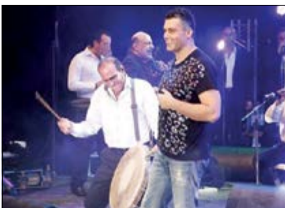
فارس كرم أثناء الحفل

المتوقع، نظرا للجمهورية والشعبية التي يملكها فارس في كل أنحاء لبنان والبلاد العربية. وعمما حصل في حفله الذي أحياه قبل مدة قصيرة في تونس، وما حكي عن فشل الحفل قال فارس، حسب «سيدتي نت»: «لم أفهم ما حصل، وهي قصة متعهدين ببعض البعض لا دخل لي بها، والصور تتكلم وعدد الناس يحكي عن نجاح الحفل»، وتابع مازحا: «على طول أنا مش