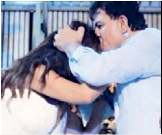
المعجب يقبل رأس نجوى كرم بعنف