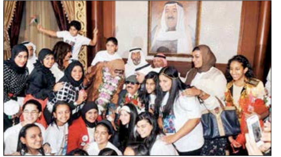
شادي الخليج بعد عودته من رحلة علاجه الأولى