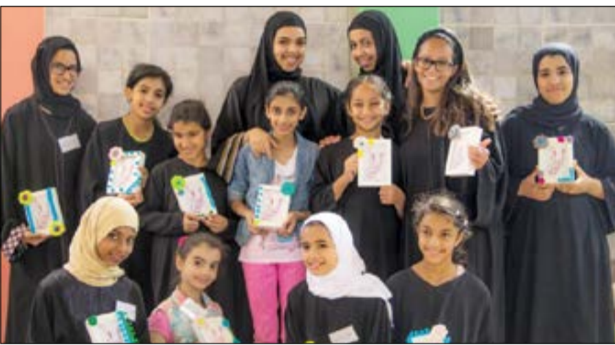
معتكف الرتييل الرمضاني الثاني لحفظ القرآن الكريم للبنات

سورتي يوسف وطه ببرنامج إيماني متكامل ممتع بالإضافة إلى حلقات السرد اليومية وتحصيح القراءة الجماعية من الساعة 11 صباحاً إلى 5 مساءً. وأشار الصمعي إلى أن هذا الصيف شمل أيضاً مشاريع تقويمها مبرة المتميزين سنويا مثل الاحتفالات القرآنية الذي يقام في شهر رمضان المبارك. وأضاف الصمعي أن إدارة شؤون القرآن البنات التابعة للمبرة أقامت النداء الصيفي الثاني «ارتق في» في مركز مسجد المشاري بمنطقة اليرموك وفي مركز مسجد خضير الشهاب بمنطقة السلام، حيث شمل برنامج ترويجية وترفيهية وثقافية تخدم فئات الشباب من سن 7 سنوات إلى 16 سنة. وأضاف الصمعي أن المبرة سيرت رحلة أهل الذكر السناسة لحفظ القرآن الكريم للبنات في المدينة المنورة لمدة 14 يوماً وأن عدد المشاركين في هذه الرحلة كان