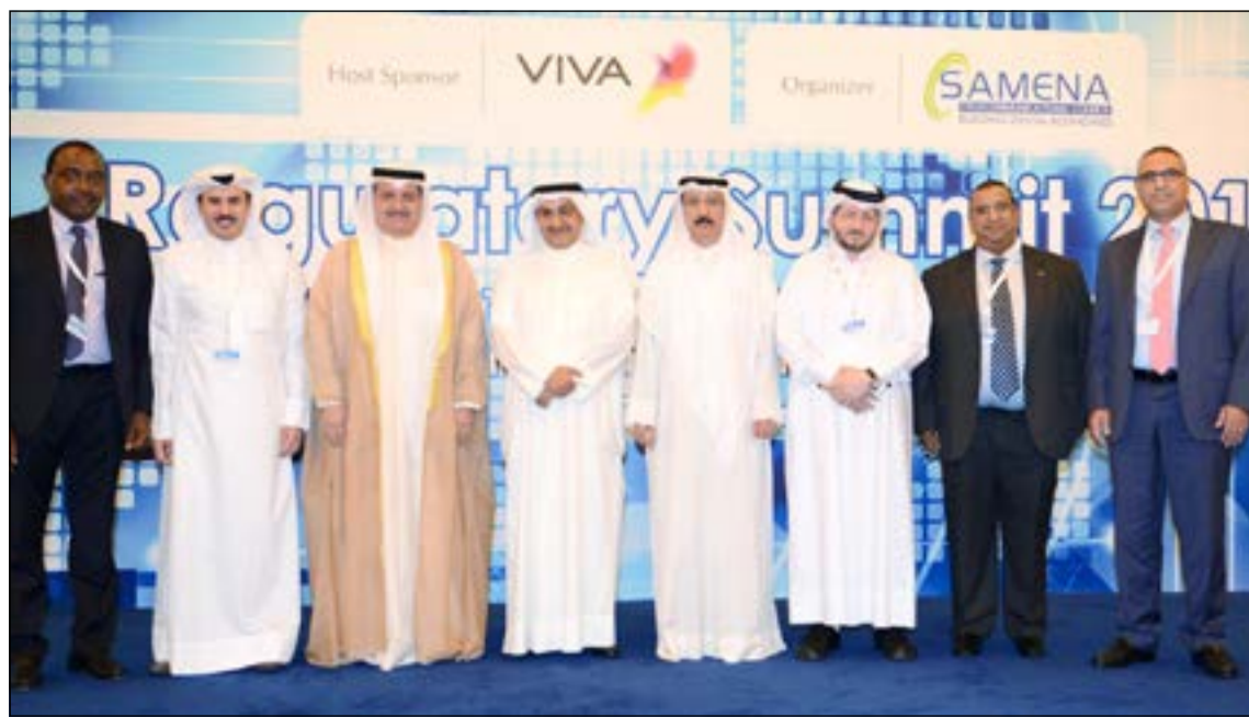
لقة جماعية مع وزير المواصلات عيسى الكندري وعادل الرومي وم. سلمان البدران وبوكار با

من جانبه حث الشمالي الحضور على المضي قدما بتنفيذ المشاريع الاستراتيجية للشركة وتوفير كل سبل الدعم لها وتذليل العقبات التي تعترضها، مؤكدا على