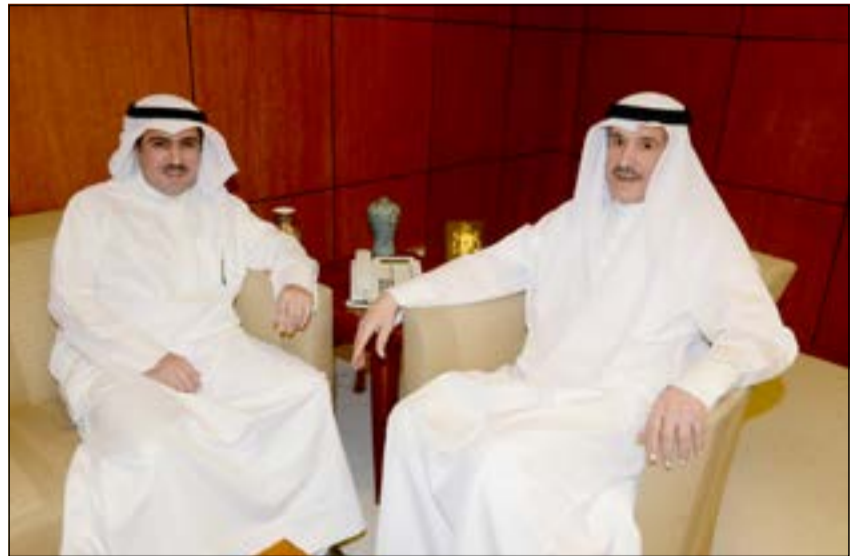
خالد الصقر مستقبلا سفيرنا في اليابان عبدالرحمن العتيبي

للإبحاث العلمية، الجهاز الفني لدراسة المشروعات التنموية، مؤسسة البترول الكويتية ممثلة من قبل شركة بترول الكويت العالمية، وزارة الصحة، بنك الكويت الوطني، بالإضافة إلى عدد من الشركات الاستثمارية الكويتية، حيث ستتم مناقشة عدة مواضيع محورية ومهمة كالوضع الاقتصادي الراهن بالكويت واليابان، الخطة التنموية الشاملة للكويت وفرص المشاركة اليابانية بها،