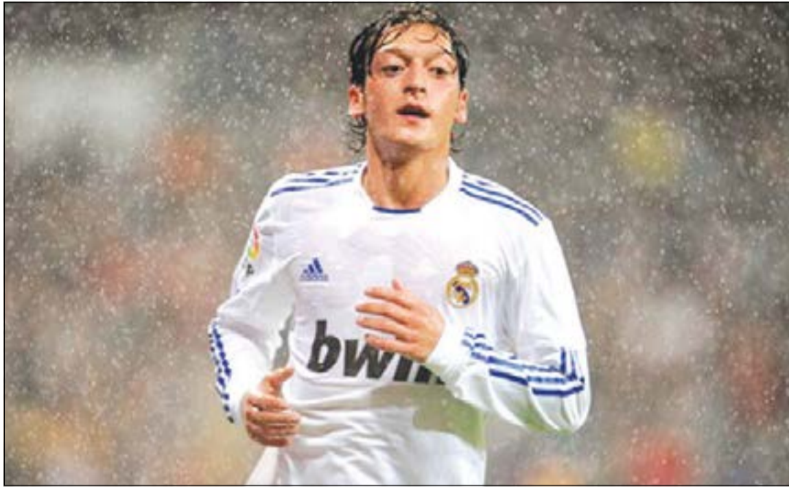
رحيل مسعود أوزيل عن ريال مدريد تسبب في غضب الجماهير واللاعبين

اعتبر لاعب الوسط الدولي مسعود أوزيل المنتقل من ريال مدريد الإسباني الى أرسنال الانجليزي مقابل 50 مليون يورو انه اختار الفريق اللندني لتقته بمدربه الفرنسي ارسن فينغر في وقت لم يعد ضمن خطط مدرب ريال الايطالي كارلو انشيلوتي.