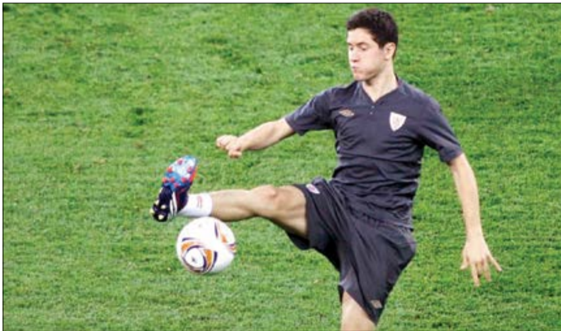
الاسباني اندر هيريرا لا يزال تحت انظار مان يونايتد

توازنه بعد الشكوك التي أحاطت بمستقبله في صفوف ايفرتون في اعلى الفخذ.