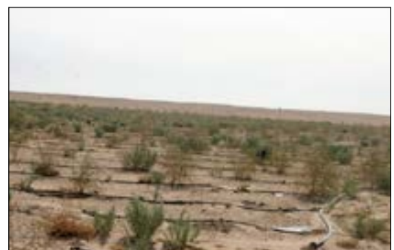
للنباتات الفطرية دور مهم في التحكم بالكثبان والرمال

الدولة لازالة الرمال من مناطق تنشط فيها الرياح. وأوضح ان الدراسة تناولت بحث الخواص المورفولوجية حول الاحزمة الخضراء والصفصاف والائل والرواسب الرملية إضافة الى 11 نوعا من النباتات الفطرية الساحلية والصحراوية، كما تم رصد كميات وتكاليف ازاحة الرمال المتراكمة حول المنشآت المدنية والعسكرية. وذكر انه تم جمع ما يقارب من 800 عينة من الكثبان والرواسب الرملية المتراكمة حول النباتات الممررة وأربعة أحمزة خضراء كالانج والصفصاف موزعة في مختلف أنحاء البلاد بهدف التعرف على خواصها المورفولوجية والكيميائية. وبين انه تم ضمن الدراسة أخذ عينات التربة من