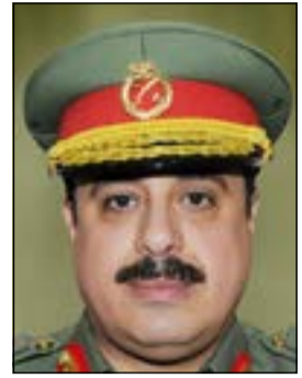
اللواء الركن م. هاشم الرفاعي

بتوجيهات من القيادة العليا للحرس الوطني ممثلة في سمو الشيخ سالم العلي الصباح رئيس الحرس الوطني والشيخ مشعل الأحمد نائب رئيس الحرس الوطني في الاهتمام بالعنصر البشري واعطائه الأولوية القصوى، أطلق وكيل الحرس الوطني بالتكليف اللواء الركن م. هاشم عبدالرزاق الرفاعي، مبادرة تحت عنوان «حارس الوطن سليم البدن» لمكافحة السممة، بهدف القضاء على البدانة وترسيخ الوعي والثقافة الصحية بين منتسبي الحرس الوطني. وقال اللواء الركن م. هاشم الرفاعي ان هذه المبادرة تأتي لتواكب جهود المجتمع في