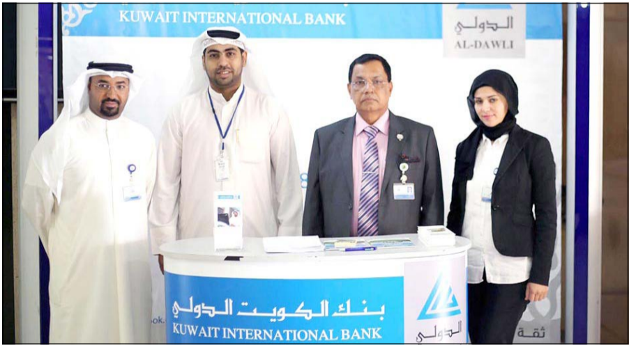
موظفو «الدولي» يتواجدون في شركة النقل العام الكويتية

التمويلية، منها المرابحة والمساومة، وذلك بهدف شراء المركبات، والمواد الاستهلاكية، و مواد البناء، والعديد من الخدمات الأخرى.