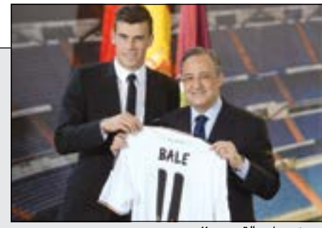
بييرز وبييل والقميص 11

استقبال أسطوري لغاريث بيل في مدريد بعد انضمامه لـ 'ريال' في صفقة بلغت 100 مليون يورو