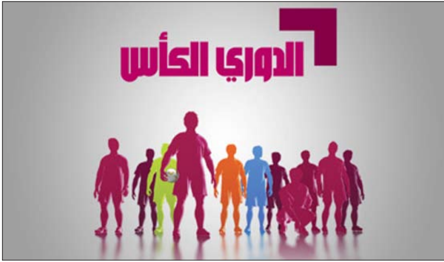
شعار قناة الدوري والكأس

لقاءات واستديوهات تحليلية. «إلى هنا انتهت الكتاب». التطورات التي صاحبت عدم نقل وزارة الإعلام عبر التلفزيون الحكومي «قناة الشباب والرياضة» لدوري «VIVA» جعلت من مجلس إدارة قناة «الدوري والكأس» يطلبون من المسؤولين في اتحاد الكرة تحديد المبلغ المطلوب لنقل الدوري بشكل حصري على قنواتهم، وهو الأمر الذي عطل الاتفاق النهائي بين اتحاد الكرة وقناة «قدساوي» الجهة الوحيدة التي كانت قد أعلنت رغبتها في نقل المباريات «كاملة وحصرية» قبل