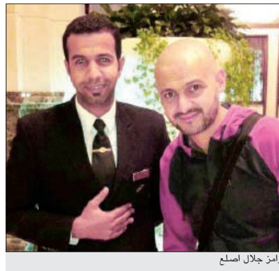
رامز جلال اصلع