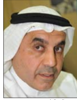
د.عبد الله الطريجي

تقدم النائب د.عبدالله الطريجي بالاقتراح بقانون بتعديل بعض أحكام القانون رقم 1967 في شأن الجيش، ونصت مواده على التالي: ● المادة الأولى: يستبدل بنص الفقرة الأولى من المادة 35 والمادة 37 من القانون رقم 32 لسنة 1967 المشار اليه النص التالي: ● المادة 35 فقرة أولى: يقبل كضباط لخصاص كل عسكري من رتبة ضباط الصف أمضى في شرف الخدمة العسكرية