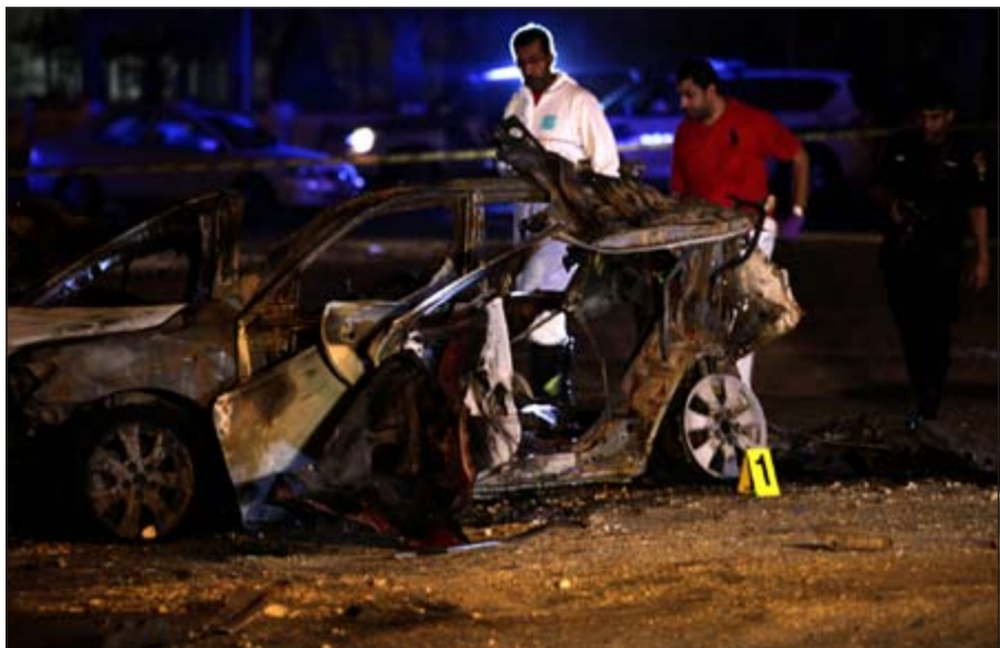
رجال الشرطة البحرينية خلال تفحصهم الأداة في موقع الانفجار امس

الأمنية باشرت على الفور عمليات البحث والتحري لتحديد هوية مرتكبي هذا العمل «الإرهابي» والقبض عليهم وتقديمهم للعدالة، كما تم إبلاغ النيابة العامة بالواقعة. جاء ذلك استئناف الحوار بين المعارضة والحكومة في البحرين، بعد توقف استمر شهرين خلال فصل الصيف. وقد بدأ الحوار الوطني في 10 فبراير الماضي بعد فشل جلسة في يوليو 2011، إذ انسحبت المعارضة آنذاك من المحادثات بعد أسبوعين على بدنها، معتبرة أنها «مهمشة»، لكن المعارضة التي تترجمها جمعية الوفاق الشيعية واصلت تنظيم التظاهرات في موازاة الحوار.