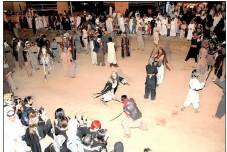
مشهد تمثيلي لجادة سوق عكاظ

وخلافها، وسيشارك نحو 200 متطوع و40 إدارياً إضافة إلى مشرف في تنظيم الزوار والعروض، وينتشر باقي العدد في المعارض الممتدة على جنبات الجادة، الافتتاح إلى أن الهيئة العامة للسياحة تقدم الدعم للجادة من عدة أوجه من بينها تطوير وتنظيم الفعاليات التراثية والثقافية، وتقديم نصف مليون ريال قيمة جائزة الحرف اليدوية بالإضافة إلى تنظيم مشاركة المجتمع المحلي (منظمين ومتطوعين)، والرقابة على جودة الخدمات في منشآت الإيواء.