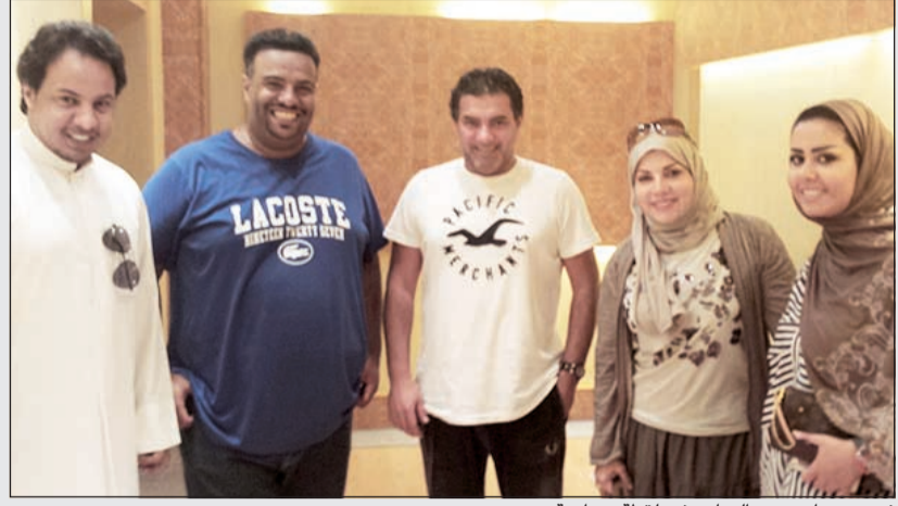
فريق برنامج «تو النهار» في لقطة جماعية