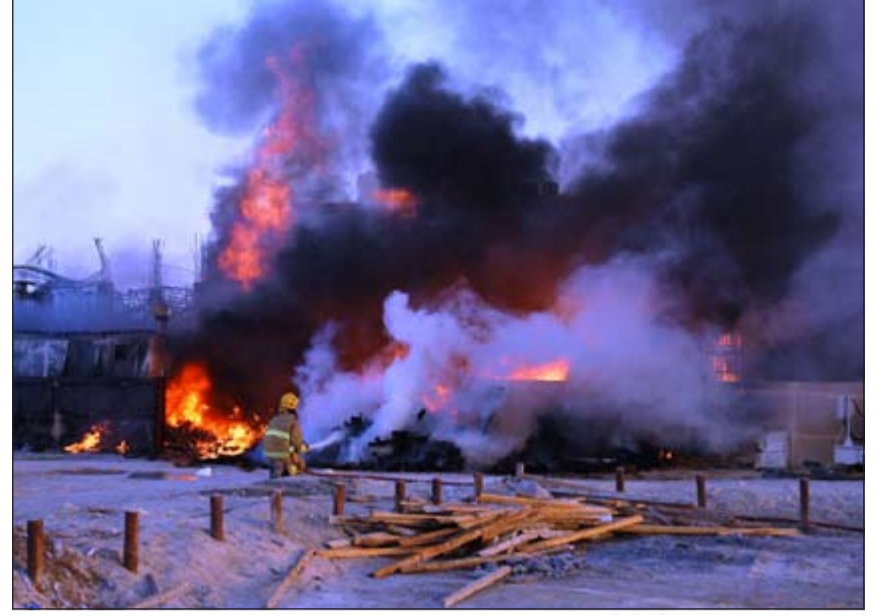
الحريق خلف سحبا دخانية كثيفة