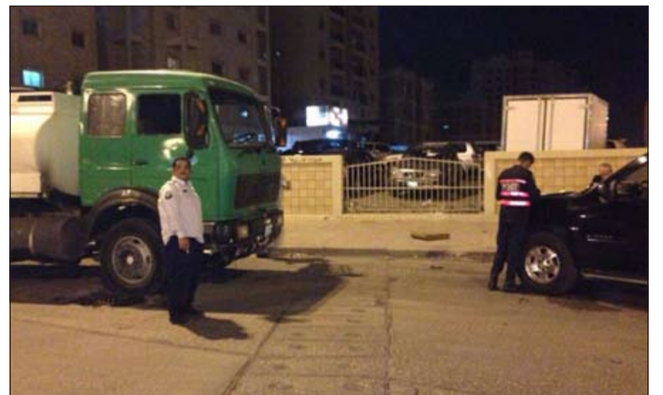
الحملة المرورية الاولى التي استهدفت تناكر نقل المياه العذبة