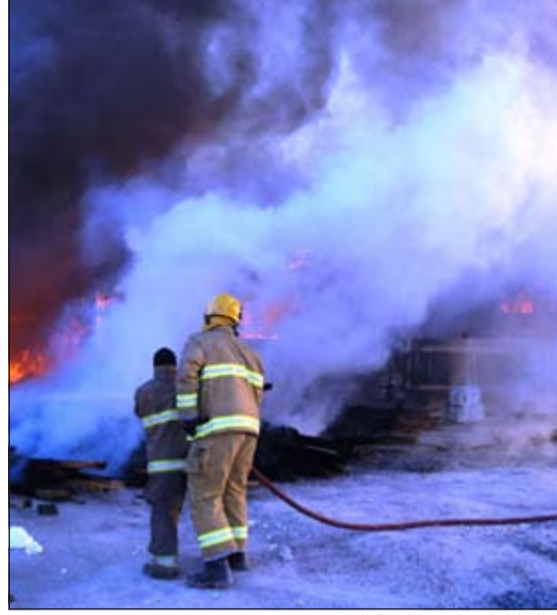
رجال إطفاء خلال مكافحة الحريق