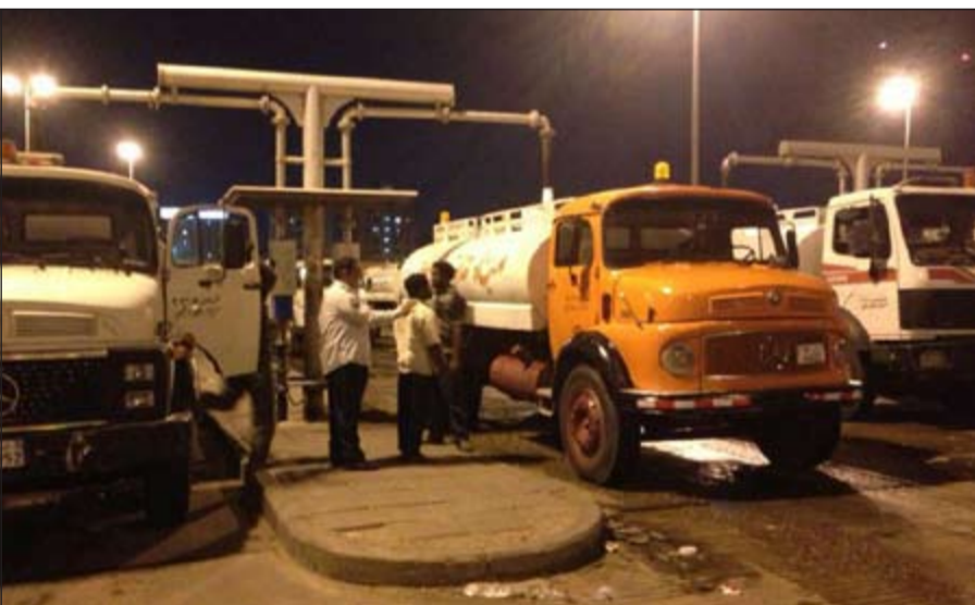
الحملة المرورية الاولى التي استهدفت تناكر نقل المياه العذبة