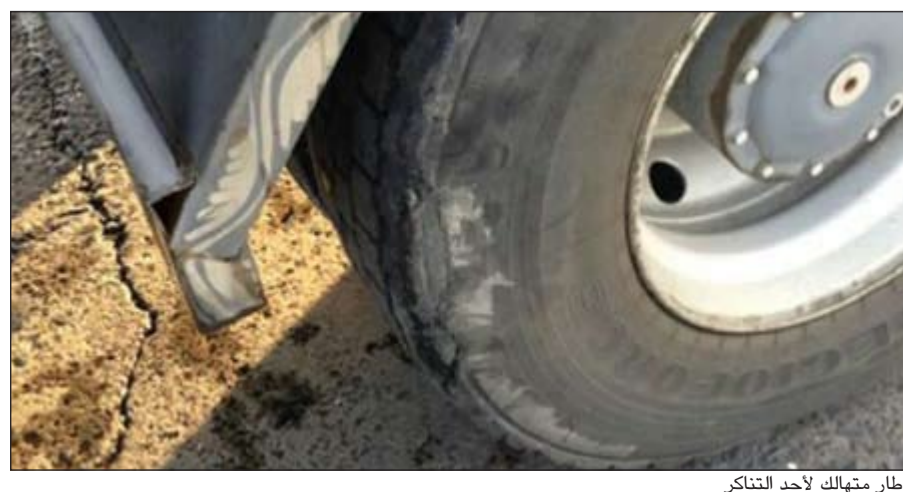
إطار متهاك لأحد التناكر