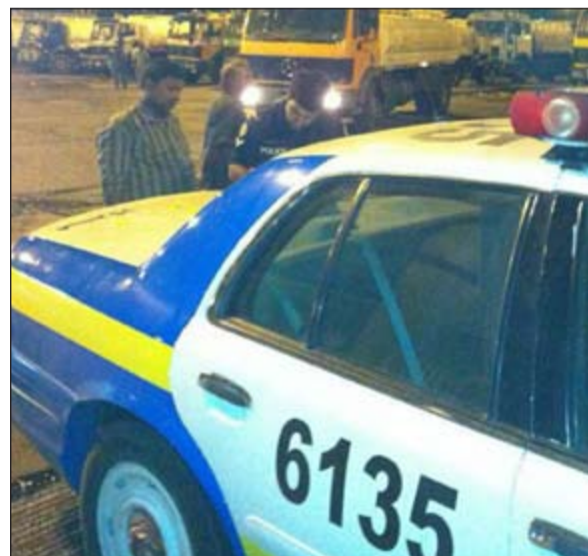
رجل مرور يذوق في اوراق أحد السائقين قبل مخالفة