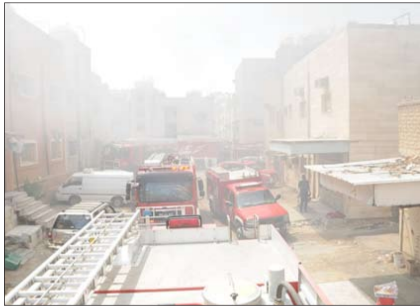
آليات الإطفاء تتواجد على مقربة من قسامم الحريق