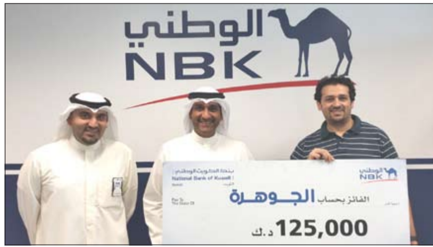
«الوطني» يسلم الفائز شيك الـ 125 ألف دينار

فقط. وكلما ازداد رصيد العميل، ازدادت فرصه بالفوز بأحد هذه السحوبات الثلاثة. وتجدر الإشارة إلى أن حساب الجوهرة يتيح للعملاء إجراء عمليات السحب والإيداع في أي وقت ولدى أي من فروع الوطني المنتشرة في كافة أنحاء الكويت. ويعتبر حساب