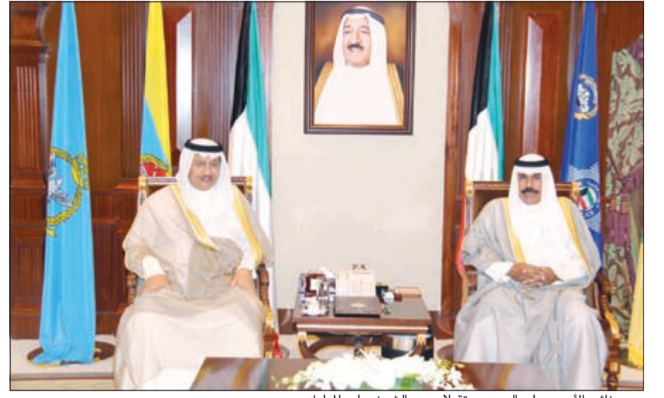
سمو نائب الأمير وولي العهد مستقبلا سمو الشيخ جابر المبارك