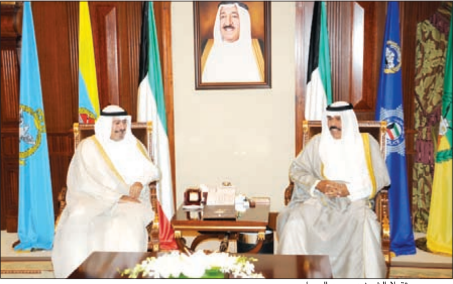
وسموه مستقبلا الشيخ د.محمد الصباح