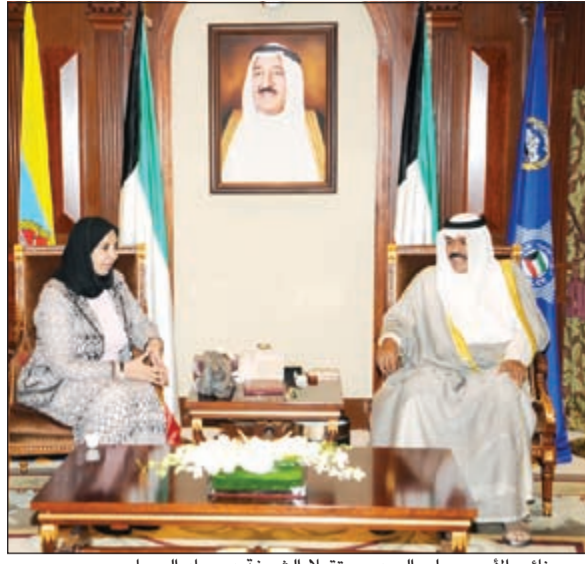
سمو نائب الأمير وولي العهد مستقبلا الشيخة د.سعاد الصباح