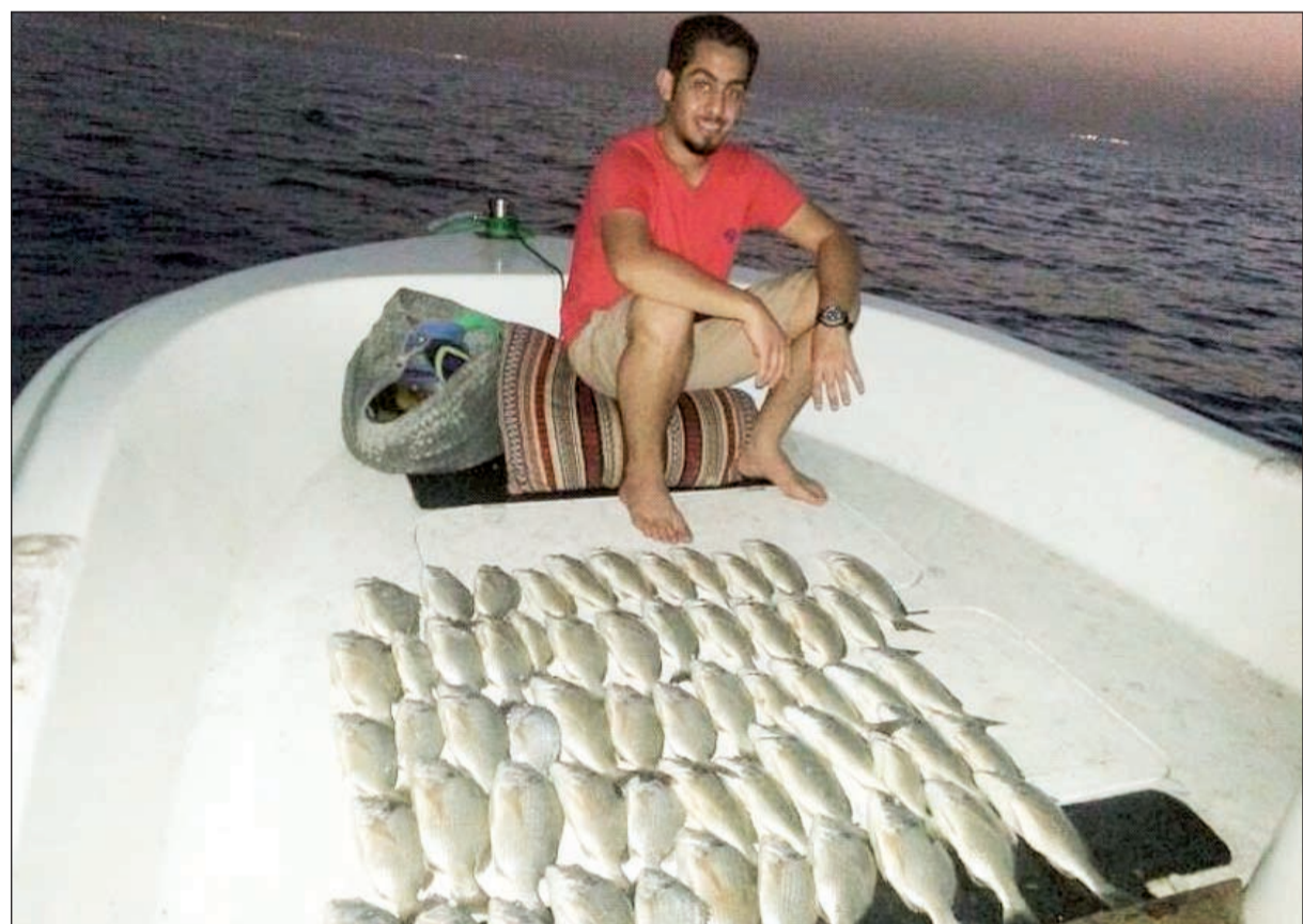
مجموعة شعوم بأحدى الرحلات البحرية

● أوجه دعوتي الأخيرة لإخواني الحداقة كافة بأن يهتموا بعودة السلامة والإسعافات الأولية كاملة دون نقصان. وفي النهاية أدعو للجميع بالسلامة والصيد الطيب الوفير.