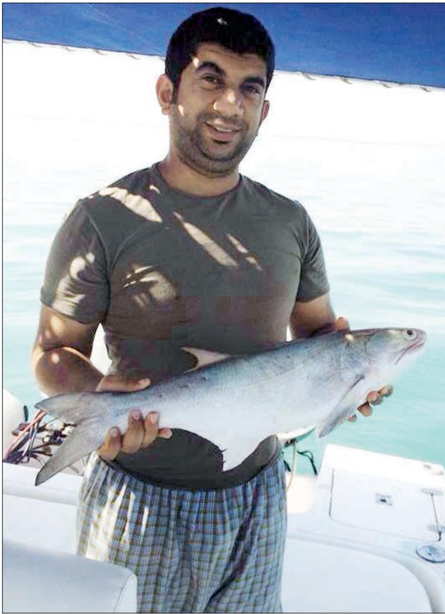
ياسلام على الشيم