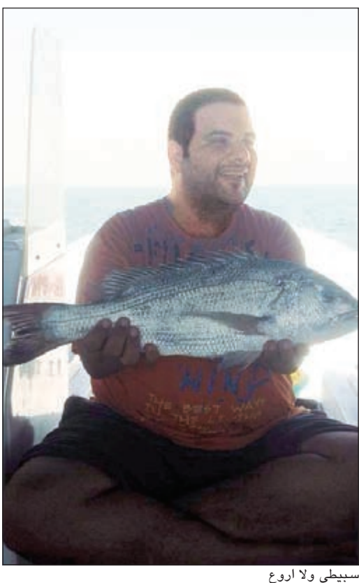
سبيطي ولا أروع