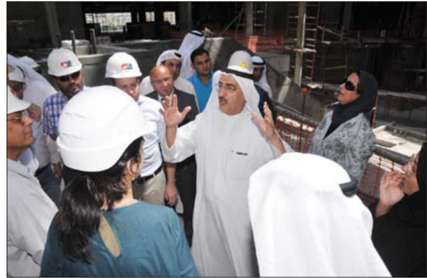
الوزير الإبراهيم يتحدث للصحافيين

عن توفير المياه المعالجة للمناطق أفاد الإبراهيم بأن هذا الكلام غير صحيح ولدينا الطاقة الاستيعابية لكافة المناطق ونسير حسب البرامج المعدة من قبل الوزارة. وقال الإبراهيم أن وزارة الكهرباء نجحت في تحقيق ربع مليار دينار فواتير كهرباء خلال 16 شهراً مضت.