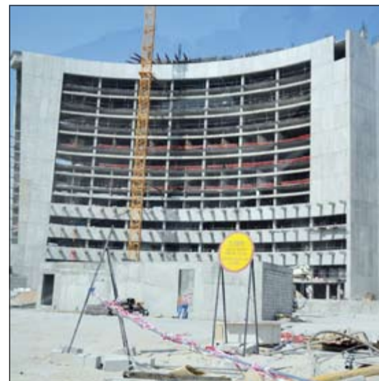
مبنى مستشفى جابر