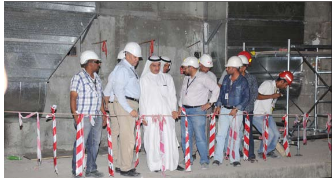
جانب من الجولة