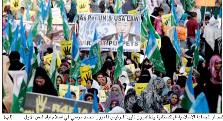
انصار الجماعة الاسلامية الباكستانية يتظاهرون بتأييد الرئيس المعزول محمد مرسي في اسلام اباد امس الاول

القاهرة - وكالات: أوقفت السلطات المصرية أمس وزير الشباب السابق أسامة ياسين مع قيادي آخر من جماعة الإخوان المسلمين، واقتادتهما إلى أحد المقار الأمنية للتحقيق معهما في اتهامات بالقتل والتحرير على قتل مظاهرين. وقالت مصادر أمنية وحقوقية مطلبة أن مجموعة أمنية من إدارات تابعة لوزارة الداخلية اقتادت القياديين في جماعة الإخوان المسلمين أسامة ياسين ووزير الشباب السابق ومحمد حافظ السكرتير الخاص لنائب المرشد العام للجماعة خيرت الشاطر، حيث يجري استجواب مبدئي في أحد المقار الأمنية قبل نقلهما إلى أحد السجون شديدة الحراسة. وكانت قوة من جهاز الأمن الوطني ومديرية أمن القاهرة وأجهزة أمنية أخرى داهمت قبلاً بصاحبة القاهرة الجديدة، حيث أُلقت القبض على ياسين وحافظ الصادر بحقهما أوامر ضبط وإحسار للتحقيق معهما، إلى جانب عشرات آخرين من أعضاء وقيادات جماعة الإخوان المسلمين، ببلاغات تتهمهم بالتحرير على قتل مظاهرين مناهضين للجماعة