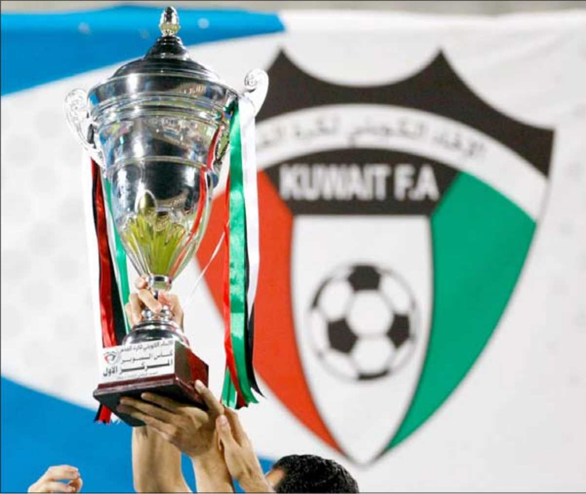
من يحمل كأس السوبر الليلة؟