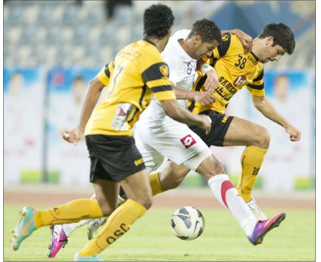
السباق مستمر بين القادسية والكويت على حصد الألقاب