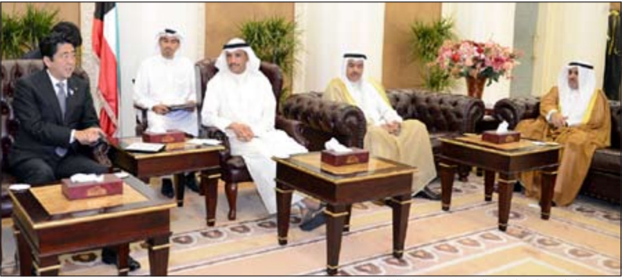
مزموق الغانم خلال استقبله رئيس وزراء اليابان

استقبل رئيس مجلس الأمة مزموق الغانم في مكتبه مجلس الأمة صباح أمس رئيس وزراء اليابان شينزو آبي والوفد المرافق له في إطار زيارته للبلاد. وبحث الغانم وآبي خلال اللقاء القضايا الإقليمية وأوضاع الشرق الأوسط حدث أشاد الغانم بالدور الياباني الداعم للسلم في المنطقة، مشيداً في الوقت ذاته بعمق العلاقات الكويتية اليابانية، مستذكراً موقف اليابان المؤيد للقضايا الكويتية ووقفها الدائم مع الحق، متمنياً موقفها الداعم للكويت إبان حرب الخليج. كما تطرق اللقاء لجملة من القضايا ذات الاهتمام المشترك، ومنها تعزيز التعاون وتطوير الشباب الكويتي وإتاحة فرص العمل والتدريب أمامه في الشركات اليابانية، بالإضافة إلى تعزيز أواصر العلاقات بين الكويت واليابان في مختلف المجالات. من جهة أخرى، استقبل الغانم في مكتبه سفيرنا لدى كوريا الجنوبية جاسم البديوي. كما استقبل الغانم سفيرنا لدى جمهورية نيجيريا د.عبدالعزیز الشراح. واستقبل الغانم سفيرنا لدى ألمانيا منذر العيسى. في سياق متصل، استقبل الغانم مندوبنا لدى جامعة الدول العربية عزيز الديحاني.