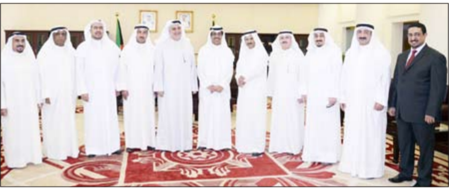
مبارك الخرينج متوسلاً وقد المستثمرين

استقبل نائب رئيس مجلس الأمة مبارك بنينه الخرينج في مكتبه ظهر أمس مجموعة من المستثمرين الكويتيين في الشركة المصرية الكويتية للتنمية والاستثمار في جمهورية مصر العربية الشقيقة.