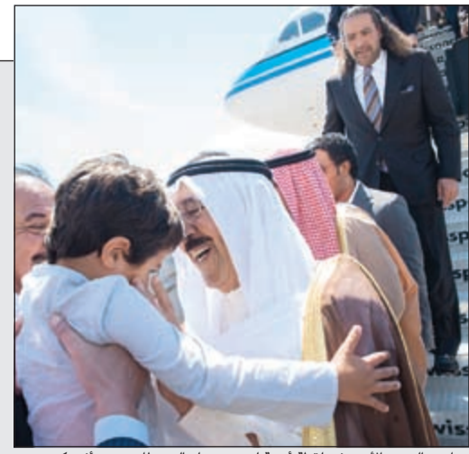
صاحب السمو الأمير في لحظة أبوية لدى وصوله إلى مطار جون. أف. كيندي

صاحب السمو وصل الولايات المتحدة في زيارة خاصة 02