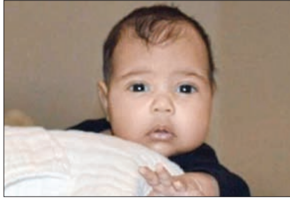
الصورة الأولى لابنة النجمين