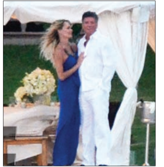
صورة نشرها موقع أي لحفل الخطوبة

يشار إلى أن أرمسترونغ تشتهر بدورها في مسلسل ربات منزل بيفرلي هيلز الحقيقية، وسيكون هذا الزواج الثاني لها بعد انتحار زوجها الأول راسل أرمسترونغ في أغسطس 2011. يذكر أن لأرمسترونغ ابنة في السادسة من العمر.