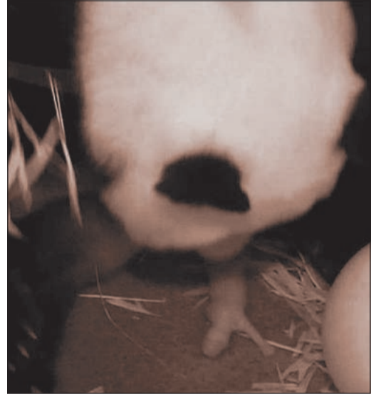
الباندا العملاقة تراقب وليدها

واشنطن - يو بي أي: استقبلت حديقة حيوانات في العاصمة الأمريكية واشنطن، جرو باندا عملاقة تردد أنه بصحة جيدة.