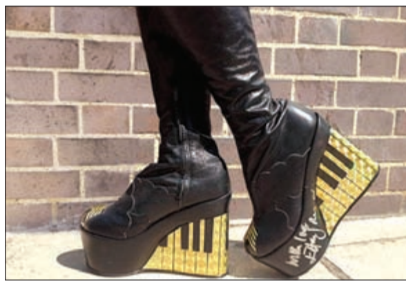
حذاء ألتون جون الشهير