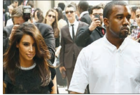
النجمان كيم كارديشيان وكاني ويست

لوس أنجليس - يو بي أي: كشف مغني الراب الأمريكي كاني ويست، عن أول صورة لابنته نورث من حبيبته نجمة تلفزيون الواقع كيم كارديشيان. وذكرت وسائل إعلام أمريكية أن ويست أطل في برنامج والدة حبيبته التلفزيوني كريس جينير، وكشف عن أول صورة لابنته من كارديشيان، منذ ولادتها في 15 يونيو الماضي.