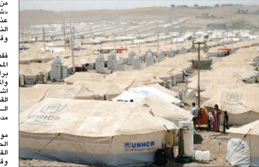
مخيم كورو غوريك للاجئين السوريين في اقليم كردستان العراق (ا ف ب)

من ذخائر وعقاد»، بحسب «شام». ووقعت اشتباكات عنيفة جنوب مدينة معرة النعمان بين الجيش الحر وقوات النظام. أما في محافظة حمص، فقد تعرضت احياء حمص المحاصرة لقصف عنيف برجماتص الصواريخ والمدفعية الثقيلة وشهدت اشتباكات عنيفة، وطال القصف مدينة الحولة وبلدة السدار الكبيرة وبيساتين مدينة تدمر. في غضون ذلك، وقعت مواجهات عند معبر كراج الحجز في حي بيستان القصر بين الجيش الحر وقوات النظام، في حلب التي تعرض ريفها لقصف من الطيران الحربي والمدفعية الثقيلة والناشبية وقريبة أروم الصغرى. وتجدد القصف العنيف والمدفعية الثقيلة على مدينة السفيرة بعد ان اعلن الجيش الحر «تحرير كتبية الدفاع الجوي (الحجيرة)» في السفيرة على يد «حركة احرار الشام».