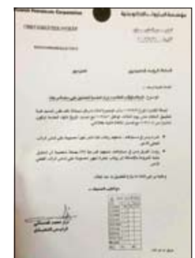
كتاب تقاعد المديريين ورؤساء الفرق

«نحن نطلب الإنصاف والعدالة والمساواة... بهذا الطلب العفوي الحزين استقبل قراء «الأنباء» خبر: (استفادة 100 مدير ورئيس فريق من «باكج» تقاعد «النفطي» الذي نشر في عدد الثلاثاء الماضي الموافق 20 أغسطس وحظي بمتابعات لافتة من القراء. وقد تواصل عدد من القياديين في القطاع النفطي ممن ينطبق عليهم التقاعد من المديريين ورؤساء الفرق مع «الأنباء» ومن مقر إقامتهم الحالية بالولايات المتحدة الأميركية وبريطانيا وكندا، حيث يقضون الإجازة الصيفية حيث اجتمعوا في حديثهم الذي تواصل لساعات على تفسير الظلم الذي وقع عليهم حيث قالوا إن الأمر جدا عليه تعسف وظلم ويتم بحجة تجديد الدماء بينما لا يزال من المسؤولين من تجاوز في عمله الـ 30 سنة ولا يزال يعقد في وينهي عقود من تجاوز في عمله الـ 30 عاما. وتم تجاذب