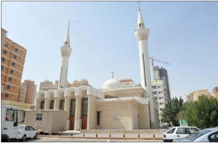
ضرورة تفعيل دور المسجد في تعزيز القيم الإسلامية بين الشراء

كيف نستطيع في خضم كل هذه المظاهر والمجالات المختلفة للغزو الثقافي أن نواجه كل هذه المجالات؟