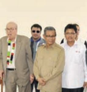
جولة داخل أحد الفصول

برجس البرجس يقدم درعا تذكارية لحاكم باندا إتشيه بيسار مخلص