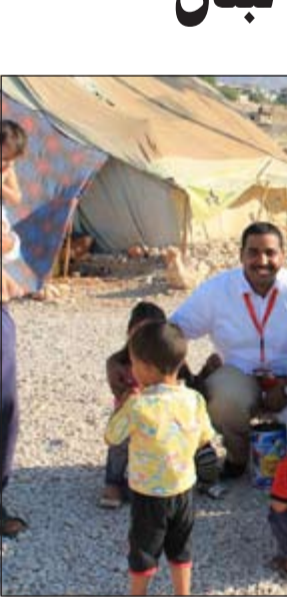
أعضاء من اتحاد أميركا خلال تقديم المعونات والهدايا للأطفال السوريين