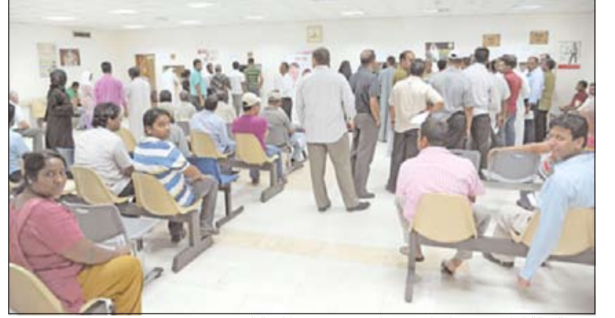
بعض العمالة الوافدة تقوم بإجراء فحص الدرن في وحدة مكافحة الدرن

المواصفات الواجب توافرها للمقيمين في بيوت الضيافة وفقا للقرار الوزاري الصادر من وزارة الشؤون رقم 199 لسنة 2010، كما لوحظ ايضا لاقامة العمالة المنزلية او غيرها من السفارات الاخرى بالالتزام بتفصيل ووضع الضوابط الخاصة بالبيئة الصحية للجمعيات السكنية المكتظة وامكان سكن العمالة في بيوت الضيافة.