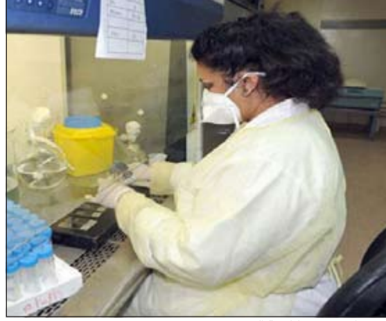
مختبرات وحدة مكافحة الدرن