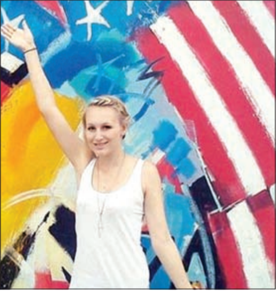
آخر صورة التقطت للشابة الضحية في أميركا

وهذا الهجوم هو السابع من نوعه في مياه هاواي منذ مطلع السنة والسابع أيضا في ماوي. وبعد الحادثة، روى شاهد عيان أنه سمع صرخة قوية أتت من البحر وأن صديقي الضحية سحبها إلى اليابسة بمساعدة شخص كان على متن زورق.