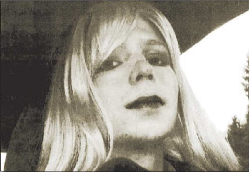
صورة لبرادلي مرتديا زي امرأة

بالتجسس. وأشار إلى أنه في فبراير الماضي اعترف مانيغ بتسريب مئات الوثائق السرية عن الحرب في أفغانستان والعراق والمراسلات الدبلوماسية في أكبر عملية تسريب وثائق في تاريخ الولايات المتحدة.