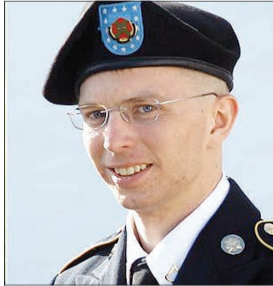
صورة مانيغ في زي العسكري

من حياتي أريد أن أعرف الجميع من أنا في الحقيقة: أنا تشيلسي مانيغ، أنا أنثى. وتابع: نظرا لما أشعر به وما شعرت به منذ الطفولة، أرغب في البدء بعلاج الهرمونات بأسرع وقت ممكن، وأمل أن تدعموني في هذه العملية الانتقالية. وطلب من الجميع أن