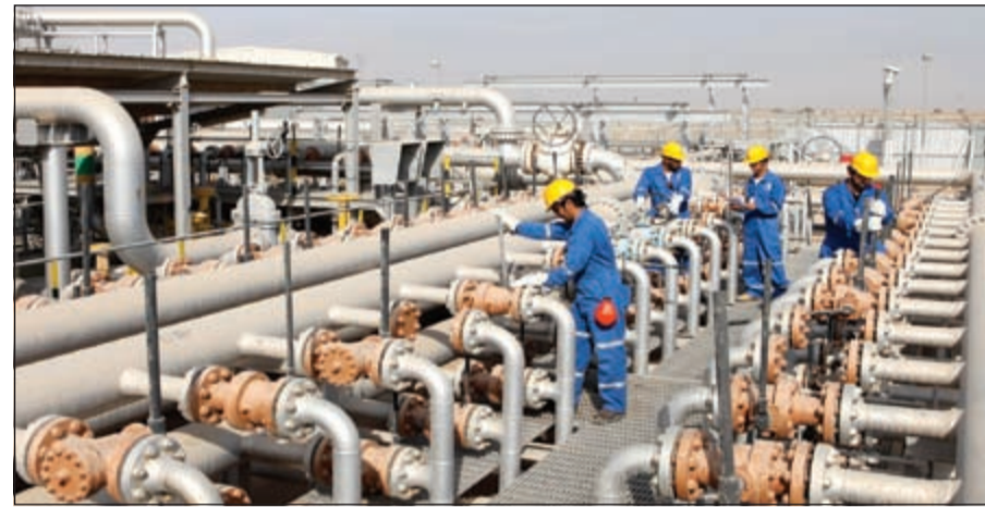
مشاريع كبرى لنفط الكويت خلال العام الحالي

للدولة والقطاع النفطي. وذكر أن «نفط الكويت» ستبدأ في طرح المناقصات الكبرى للمشاريع التي تأجلت بعض الشيء نظراً لتأخر اعتماد ميزانية الشركة، مبيناً أن الشركة لديها أكثر من 68 مشروعاً ضخماً سيتم طرحها العام الحالي بميزانية مرصودة لتلك المشاريع والمناقصات بقيمة 2,9 مليار دينار سيتم تنفيذها تباعاً ابتداءً من العام الحالي حتى 3 أعوام من الآن. وبين المصدر أن أول المشاريع الكبرى التي قامت الشركة بالبدء فيها خلال العام الحالي