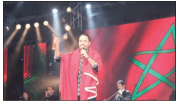
رامي عياش في الحفل

أحيا المطرب اللبناني رامي عياش مساء يوم السبت الماضي واحداً من أضخم مهرجانات