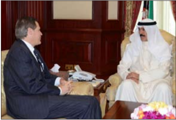
الشيخ محمد الخالد خلال استقباله السفير الأميركي