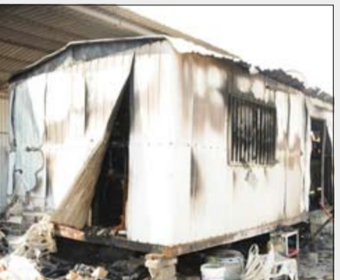
حريق الشبرات تم السيطرة عليه