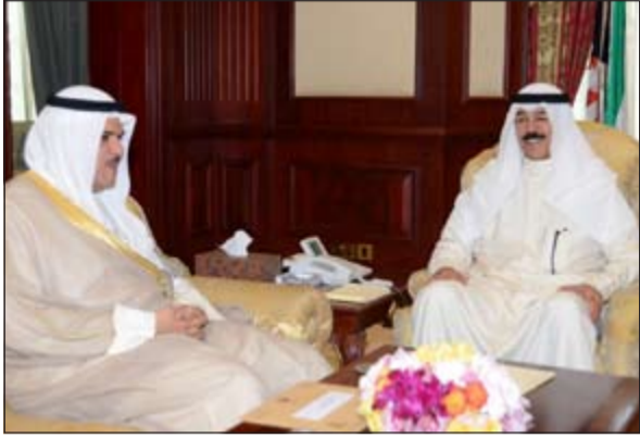
.. وحديث باسم بين الوزير الخالد والحمود

استقبل نائب رئيس مجلس الوزراء وزير الداخلية الشيخ محمد الخالد في مكتبه بمقر وزارة الداخلية صباح امس ماثيو تولر سفير الولايات المتحدة الأميركية لدى الكويت. وقد رحب الخالد بضيفه، مؤكدا عمق علاقات الود والصداقة والتعاون الأمني بين البلدين الصديقين، ومنها باهمية تعزيز هذه العلاقات.