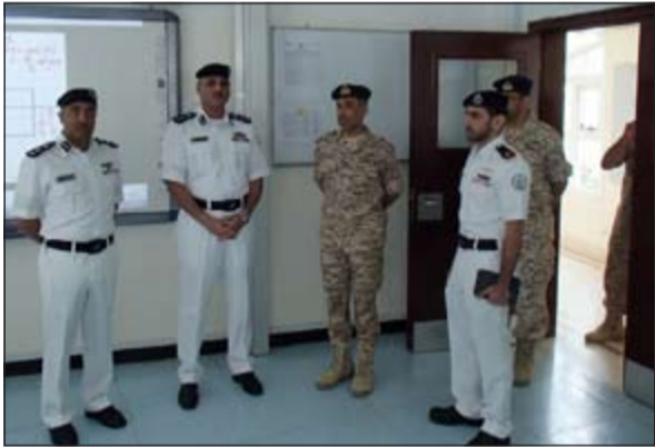
الزيارة جاءت بتعليمات من اللواء الشيخ محمد اليوسف

بناء على توجيهات وكيل وزارة الداخلية المساعد لشؤون أمن الحدود اللواء الشيخ محمد اليوسف بضرورة التنسيق والتعاون بين أجهزة الأمن في دول مجلس التعاون وذلك لتفعيل دور رجال الأمن والقيام بالمهام المناطة بهم، قام وفد من الإدارة العامة لخفر السواحل صباح امس بزيارة الى كلية راشد بن سعيد آل مكتوم البحرية بدولة الإمارات العربية المتحدة الشقيقة، وذلك للاطلاع على الامكانيات والخطط التعليمية والتطوير الذي وصلت اليه الكلية البحرية. وضم وفد الإدارة العامة لخفر السواحل المكلف بالزيارة كل من مدير ادارة التشكيلات عقيد بحري صالح سالم الفودري، مدير مركز التدريب التخصصي عقيد بحري عبدالكريم مهدي كرم ورئيس قسم العمليات البحرية رائد ركن بحري مبارك علي الصباح.