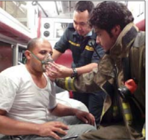
أحد سكان بناية خيطان تقدم اليه الاسعاف الأولية

استمراراً للجهود المبدولة من قبل الإدارة العامة لمكافحة المخدرات في ضبط ومتابعة مهربي المخدرات ومروجيها في اطار القضاء على هذه الظاهرة السلبية التي تضر بالمجتمع، تم ضبط شخصين أسويين وبحوزتهما 200 غرام من مادة الهيروين المخدرة وكمية من المؤثرات العقلية. وقد وردت معلومات الى الإدارة العامة لمكافحة المخدرات بإدارة العمليات تفيد بان هناك شخصاً أسويي الجنسية يقوم بترويج المواد المخدرة حيث يقوم بوضع المخدرات في أماكن يحددها للمتعاطين والمدمنين لعدم كشف هويته، ونجحت التحريات المكثفة التي قام بها رجال إدارة العمليات في التوصل لبياناته كاملة وتم استصدار اذن قانوني من النيابة العامة لضبطه وبمداهمة مسكنه عمر به على 50 غراماً من مادة الهيروين النقي، وخلال التحقيقات اعترف بوجود شريك له في الاتجار بالمخدرات وأبدي تعاونه للإرشاد عنه وتم الانتقال الى مسكن شريكه حيث تم ضبطه وبحوزته 150 غراماً من مادة الهيروين النقي وكمية من المؤثرات العقلية نوع «وروش» وبالتحقيق معه اعترف بانته يقوم بالاتجار بالمخدرات مع شريكه منذ فترة، وتمت احالة المتهمين والمضبوطات الى جهة الاختصاص. ● عبدالله فنيص- هاني الظفيري