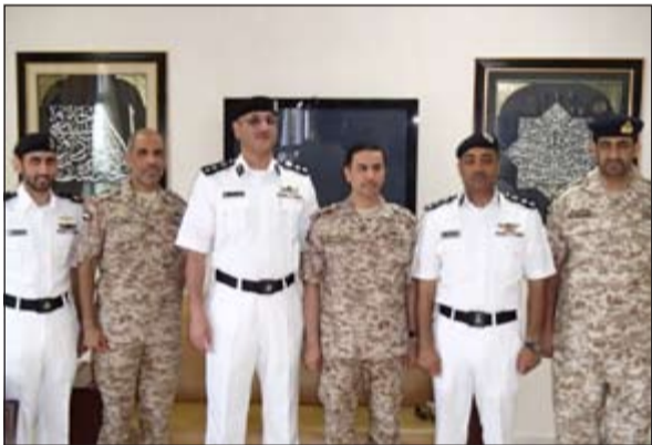
وفد السواحل اطلع على آلية العمل في اكااديمية المکتوم