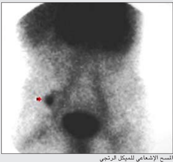
المسح الإشعاعي للميكل الرجعي

ان التهابات أو العدوى، من رتج ميكل هو غالباً ما يتم الالتئام بينها وبين التهاب الزائدة الدودية وعلى هذا الأساس اعتبر الفحوصات مفيداً للتمييز