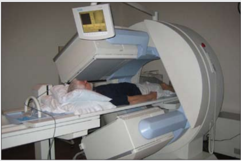
التصوير النووي باستخدام جاما كاميرا