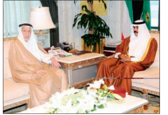
سمو نائب الأمير وولي العهد الشيخ نواف الأحمد مستقبلاً عبدالعزیز العدساني