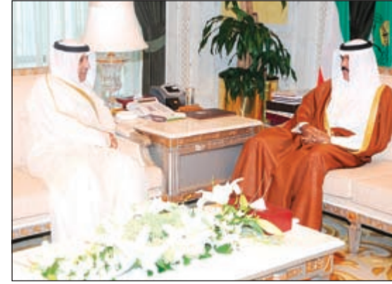
سمو نائب الأمير مستقبلاً عزيز الديحاني

استقبل سمو نائب الأمير وولي العهد الشيخ نواف الأحمد في ديوانه بقصر السيف صباح أمس رئيس ديوان الحاسبة عبدالعزیز العدساني.