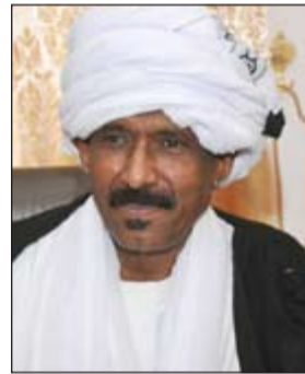
السفير يحيى محمود

قام سفير جمهورية السودان لدى الكويت يحيى عبدالجليل محمود بزيارة لجمعية الهلال الأحمر، حيث التقى مدير عام الجمعية عبدالرحمن محمد العون.