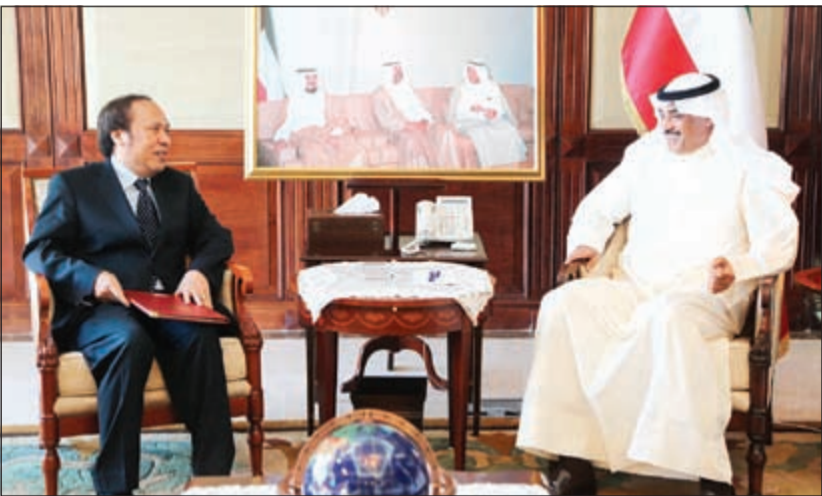
الشيخ صباح الخالد خلال لقائه سفير فيتنام

استقبل رئيس مجلس الوزراء بالإنابة وزير الخارجية الشيخ صباح الخالد أمس سفير المملكة المتحدة لدى البلاد فرانك بيكر، حيث بحث معه سبل توطيد العلاقات الثنائية بين البلدين الصديقين في جميع المجالات.