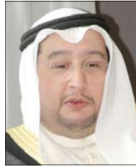
الشيخ د. صباح جابر العلي

نعى رئيس اتحاد الموائى العربية مدير عام مؤسسة الموائى الكويتية الشيخ د. صباح جابر العلي الراحل د. علي بن شكر سفير الإمارات لدى البلاد، وتقدم صباح العلي بأحر التعازي إلى رئيس دولة الإمارات العربية المتحدة الشقيقة الشيخ خليفة بن زايد آل نهيان.