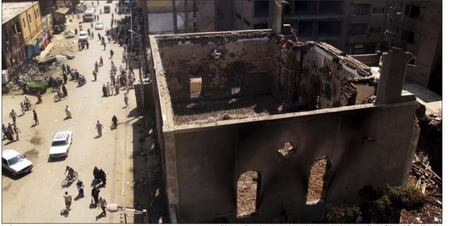
انقاض الكنيسة الانجيلية في ملاوي جنوب المنيا بعد حرقها ونهبها من حشد غاضب الخميس الماضي