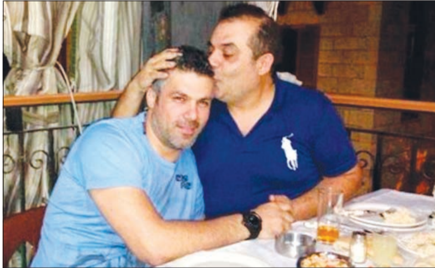
صورة تجمع فارس كرم وسليم سلامة

نشتر فارس كرم صورة تجمعها بالملحن سليم سلامة عبر حسابه على «تويتر»، وغرد قائلا: «أحلى سهرة بجزيين، أنا وصديقي سليم سلامة»، ليرد عليه سلامة: «العالم أنت وما أعلى منك كبير»، فاجأ تبادل التغريدات بين فارس وسلامة كثيرين، فالمعروف أن هناك قطعة بينهما منذ 5 سنوات يوم تعاونوا معا برفقة الشاعر فارس اسكندر وقدموا أجمل الأغنيات التي أسهمت في نجومية فارس كـ «الثورة»، و«اختيار على العكاز»، وذكر موقع «أنا زهرة» أن المياه عادت لجاريها بين سلامة وكرم إلى الأضواء.