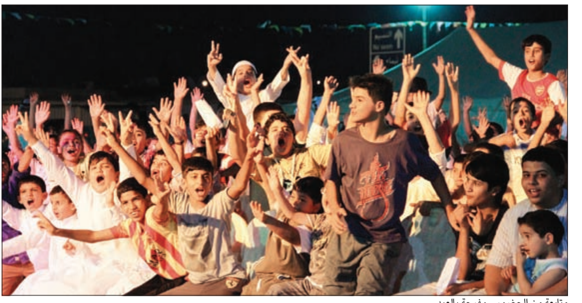
متابعة من الحضور.. وفرحة بالعيد

أعلنت شركة الحمضي للصناعات الغذائية «محمصة الرفاعي» عن انتهاء عرضها لشهر رمضان لسنة 2013 «اشتر بقمعة 10 د.ك وادخل السحب للفوز بجوائز نقدية بـ 10,000 د.ك». وذكرت شركة الحمضي للصناعات الغذائية أنه تقرر أن تجري السحب على جوائز الحملة يوم الثلاثاء الموافق 20 أغسطس 2013 الساعة 11,00 صباحاً في فرع الرفاعي الرئيسي الكائن في مجمع الخليجية في منطقة شرق. وستقدم الشركة للفائزين في السحب جوائز نقدية قيمة هي: – الجائزة الأولى: 5000 د.ك – الجائزة الثانية: 2000 د.ك – الجائزة الثالثة: 1000 د.ك – الجائزة الرابعة: 500 د.ك – الجائزة الخامسة: 450 د.ك – الجائزة السادسة: 350 د.ك – الجائزة السابعة: 250 د.ك – الجائزة الثامنة: 200 د.ك – الجائزة التاسعة: 150 د.ك – الجائزة العاشرة: 100 د.ك