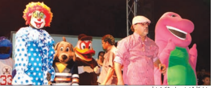
مشاركة الشخصيات الكرتونية