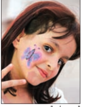
الرسم على الوجوه