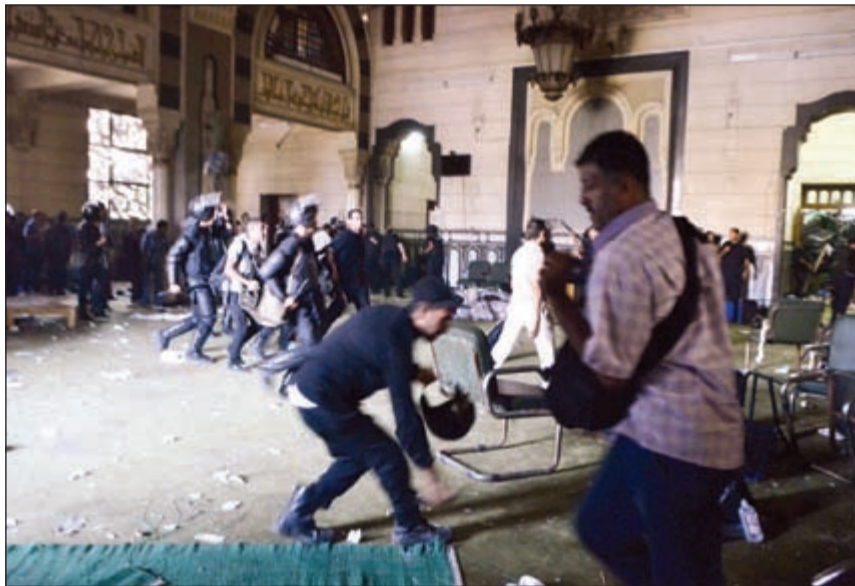
جانب من المواجهات بين قوات الامن والمتصمين في مسجد الفتح بالقاهرة أمس قبل إخلائه (أ.ف.ب)

القاهرة - أ.ش.أ: أصدرت سفارة الولايات المتحدة الأميركية بالقاهرة أمس رسالة تحذير أمنية جديدة أعلنت فيها أنها ستغلق أبوابها اليوم، كما سيتم تعليق الخدمات القنصلية العادية، وقالت السفارة الأميركية - في بيان - «إنه إذا كان لأي مواطن أميركي موعد لخدمات المواطنين الأميركيين في ذلك اليوم فستتم إعادة جدولته الموعد، وإذا كان المواطن بحاجة إلى خدمة الطوارئ فيرجى الاتصال بالسفارة على أرقام (2797 - 3300)». وأشارت إلى أن إمكانية اندلاع احتجاجات في محيط السفارة لاتزال مستمرة، ولهذا يرجى عدم التوجه إلى السفارة ما لم يتم إرسال تعليمات محددة من السفارة للقيام بذلك.