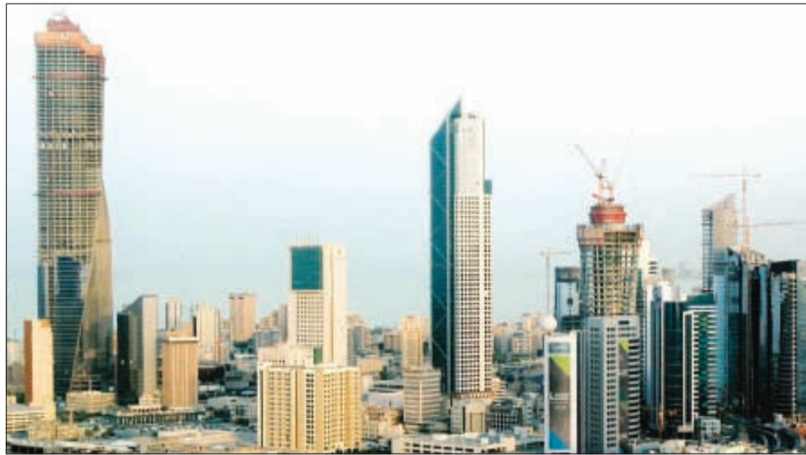
انخفاض التداول على العقارات الخاصة وارتفاع العقارات الاستثمارية والتجارية والمخازن والحرفية خلال شهر يونيو الماضي