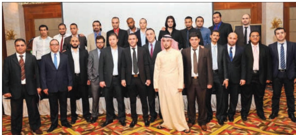
صورة جماعية خلال الحفل

بها كل ما يحتاجه العميل من ناد صحي ومركز تسوق عالمي يلي كل طباع العملاء وكافيتريات ومطاعم متنوعة تلبى كافة الأذواق وتنقسم الوحدات السكنية هناك إلى قتل وشقق وشاليهات كلها تطل على بحيرات صناعية. وبين أن مشروع «سافانا»