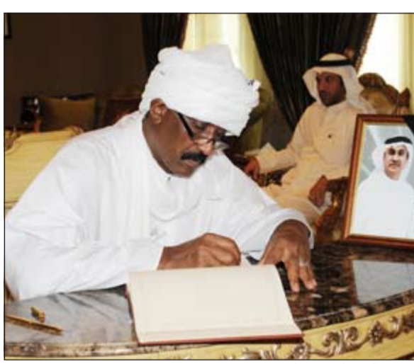
السفير السوداني معزيا

كما أعرب الخالد في تصريح لـ «كونا» وتلفزيون الكويت عن تعازيه ومواساته باسم الكويت اميرا وحكومة وشعبا الى سمو امير دولة الامارات الشيخ خليفة بن زايد آل نهيان ووزير الخارجية الشيخ عبدالله بن زايد آل نهيان وأسرة الفقيد والشعب الإماراتي بوفاة السفير الإماراتي، مضيفا انه على الرغم من قصر المدة التي عمل بها في الكويت فإنه استطاع نسج شبكة علاقات مميزة مع الجميع. وذكر ان العلاقات الدبلوماسية والاجتماعية التي اقامها الفقيد عززت من اواصر المحبة والمودة بين البلدين وأسهمت في فتح آفاق جديدة للعلاقات الممتازة بين البلدين.