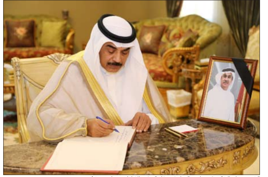
الشيخ صباح الخالد يقدم واجب العزاء في وفاة السفير الاماراتي د.علي بن شكر

عريف عن حزنه لوفاة السفير بن شكر وكتب في سجل التعازي «بلغني بمزيد من الحزن والأسى نبأ وفاة صديقي وأخي علي بن شكر وأنضرع إلى الله أن يتغمد الفقيد بواسع رحمته ويسكنه فسيح جناته ويلهم أهله الصبر والسلوان».