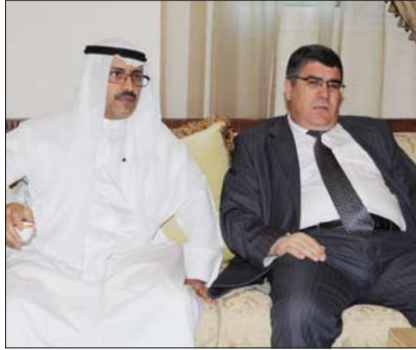
السفير الجزائري خلال تقديم العزاء