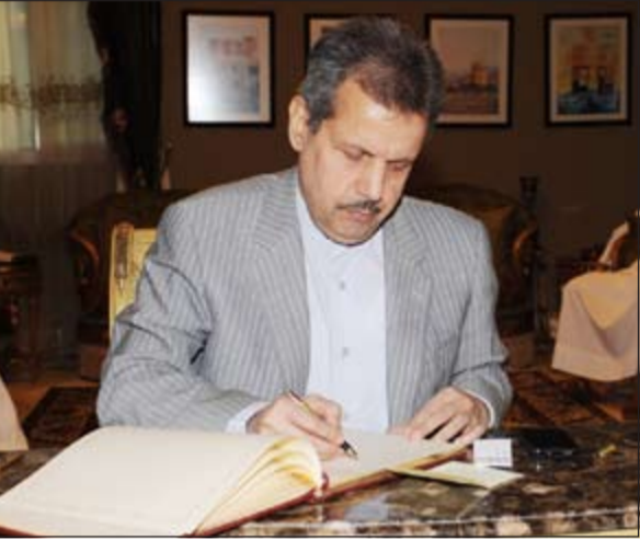
السفير الإيراني يسجل كلمة بسجل التعازي

عريف عن حزنه لوفاة السفير بن شكر وكتب في سجل التعازي «بلغني بمزيد من الحزن والأسى نبأ وفاة صديقي وأخي علي بن شكر وأنضرع إلى الله أن يتغمد الفقيد بواسع رحمته ويسكنه فسيح جناته ويلهم أهله الصبر والسلوان».