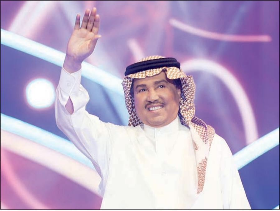
فنان العرب محمد عبده اثناء الحفل

نجد نصوصا خالية من العيب، لكن البركة بالشباب ممن تأثروا بالقامات الكبيرة، وتبقى هناك محاولات على استحياء من بعض الشعراء الذين صنعوا لأنفسهم خطا متميزا ومستقلا، ثم تحدث عن معايير الأغنية القوية قائلا: «عندما تواكب الأغنية الأحداث اليومية، تكون أكثر فعالية وتأثيرا في المجتمع، مثلا ظهرت «الإماكن» في وقت كانت هناك أزمة إنسانية في العالم العربي، أيضا تعلق المهاجرون العرب باغنية «بعاد» لأنها تعبر عن حنينهم وحبهم لوطنهم، والشاعر الذي يعايش معاناة الناس هو من يترجمها بذكاء إلى كلمات، ثم تأتي الموسيقى التي هي لغة العالم التي تحملها أينما ذهبنا».