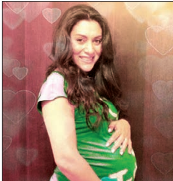
مايا نصري حامل

بحسب «إيلاف»، أنها في شهرها الثامن لكنها رفضت الكشف عن جنس المولود في الوقت الحالي. الجدير بالذكر أن آخر ظهور فني لمايا كان في رمضان قبل الماضي من خلال مسلسل «سر علني»، وكشفت أن سبب غيابها عن الشاشة في رمضان المنصرم كان حملها، رغم تلقيها عدة عروض تمثيلية في مسلسلات رمضان مهمة، لكنها فضلت عدم المخاطرة وبذل مجهود في شهر الحمل الأولى، وقضت الأشهر الماضية في راحة تامة بانتظار الحدث السعيد، والذي تكتمنا عليه طيلة هذه المدة لأنها لم تشأ إعلانه في البداية.