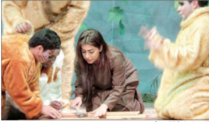
غادة في احد اعمالها المسرحية

ممثلي يفكر انه ينتج برنامج كوميدي يكون فيه البطل علشان يبرز الطاقات الفنية المكبوتة عنده مثل مايقول.. الحمدلله والشكر!