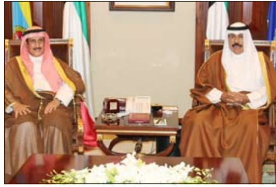
سمو نائب الامير مستقبلا الشيخ د.ابراهيم الدعيح