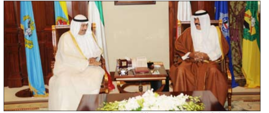
سمو نائب الامير وولي العهد الشيخ نواف الاحمد مستقبلا الشيخ د.محمد الصباح