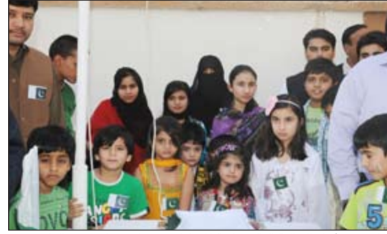
جانب من أبناء الجالية الباكستانية المشاركين في الاحتفال برفع العلم

العديد من التحديات. وأضاف «أن انتقال السلطة السلمي من حكومة الى أخرى رسخ جذور الديموقراطية الى ما بعد ذلك. وثمة نظام قضائي مستقر، واعلام مسموع ومجتمع مدني ديناميكي، التي توفر أساسا متينا لمستقبل أكثر اشراقا لباكستان». وفي ختام الحفل، كان