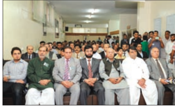
الحضور في قاعة احتفالات القائد الأعظم