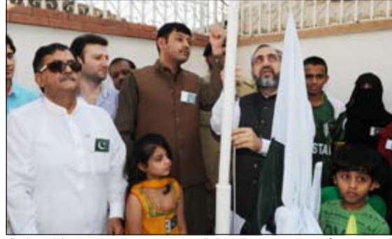
السفير سيد أبرار حسين يرفع العلم الباكستاني في مقر السفارة (قاسم باشا)