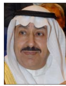
الشيخ علي العبد الله الاحمد

بحث وكيل وزارة الخارجية بالإنابة الشيخ علي عبدالله الاحمد موضوع تأشيرات المواطنين الكويتيين الراغبين في السفر الى الولايات المتحدة الأميركية وتحديد تأشيرات الطلبة خلال استقباله امس لسفير الولايات المتحدة الأميركية لدى البلاد ماتيو تولر. ونقل وكيل وزارة الخارجية بالإنابة خلال اللقاء ما توليه القيادة