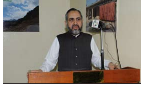
السفير سيد أبرار حسين يلقي كلمته