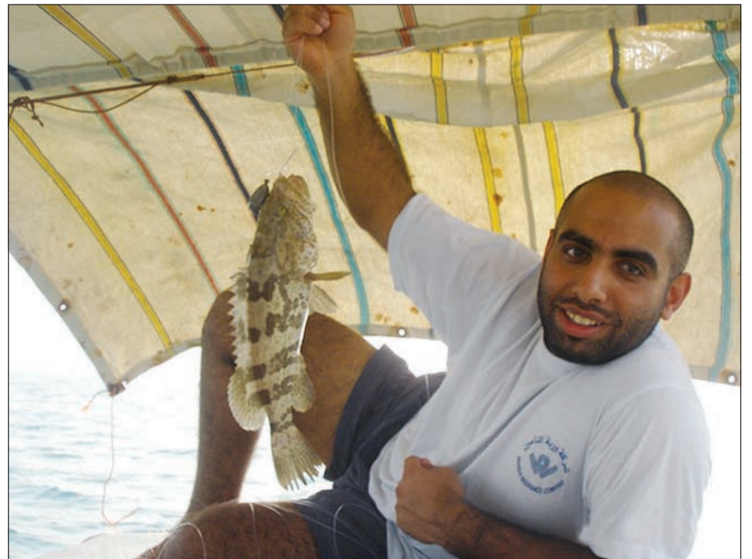
بالر متعوب عليه