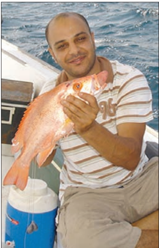
صيد الأوقات الجنوبية غير