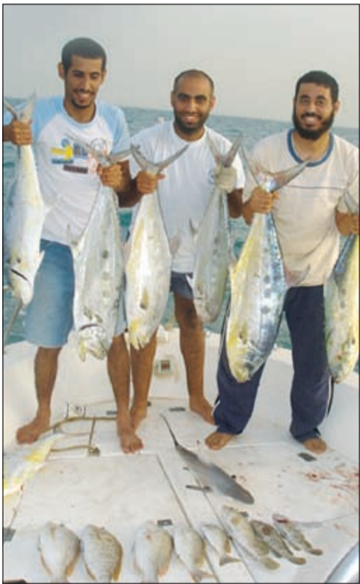
صيد متنوع بإحدى الرحلات