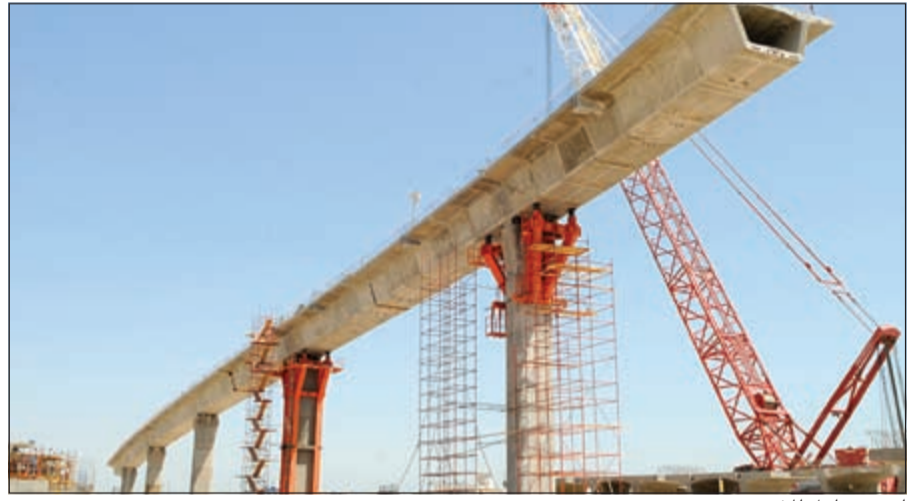
إحدى مراحل المشروع

وأضاف انه تم استكمال 288 قاعدة عامود و 212 عامود خرساني و 28 من وحدات الركائز الرئيسية للجسور وذلك في جميع مراحل العمل بالمشروع. وتم إنتاج 1174 قطعة من قطع الجسور التي يتم تصنيعها في ساحة الصب والإجهاد المسبق في منطقة الدوحة وتوريد وتركيب 342 قطعة. وقال انه وفقاً لالتزامها بتطوير البنية التحتية وشبكة الطرق في الكويت، تقوم وزارة الأشغال العامة بتنفيذ مشروع تطوير طريق الجهراء الذي يهدف إلى تحويل الطريق القائم إلى طريق سريع متعدد الأدوار بمواصفات عالمية وتتقدم بالاعتزاز عن أي اضطراب قد تسببه أعمال المشروع.