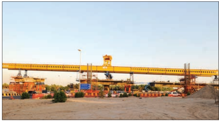
إحدى الرافعات التي تستخدم في المشروع