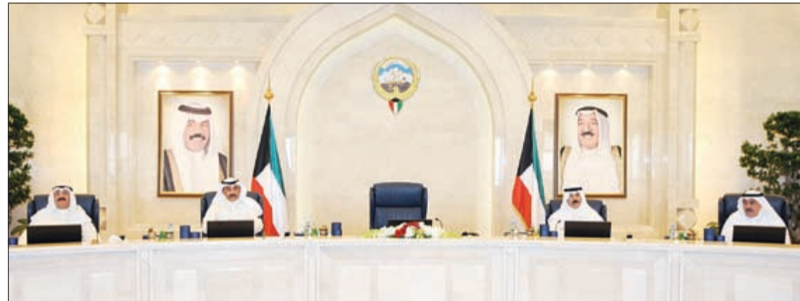
الشيخ صباح الخالد مقرئاً جلسة مجلس الوزراء وإلى جانبه الشيخ محمد الخالد والشيخ سالم عبدالعزيز ومصطفى الشمالي (التفاصيل ص 3)

أكدت وزيرة الشؤون ذكرى الرشيدى أنها لم تعين أي قريب لها حتى الدرجة الخامسة أو السادسة في أي مناصب إشرافية متحدية أثبات تعيينها شخصاً واحداً في أي وظيفة إشرافية خلال تسلمها حقيبة الشؤون. وأوضحت الوزيرة -في رد مفصل تلقت «الأنباء» نسخة منه - أن قبيلة الرشيدية تعد إحدى شرائح النسب الاجتماعي بالكويت وتعدادهم بعشرات الألوف ويعاملون بوزارة الشؤون كسائر موظفي الوزارة، لافتة إلى أن كونها تنتمي إلى هذه القبيلة الكريمة وهو شرف تحمله