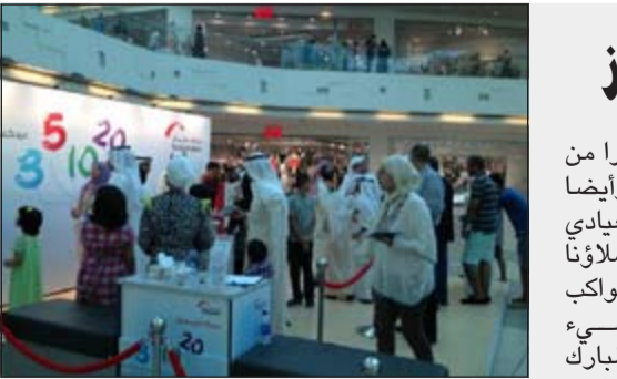
جناح البنك في الأفيوز