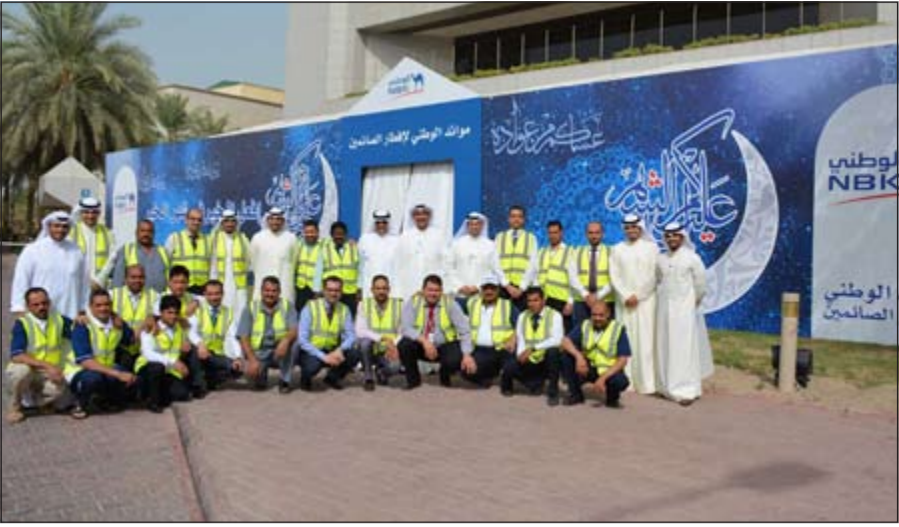
صورة جماعية لموظفي البنك الوطني المتطوعين مع قيادات البنك