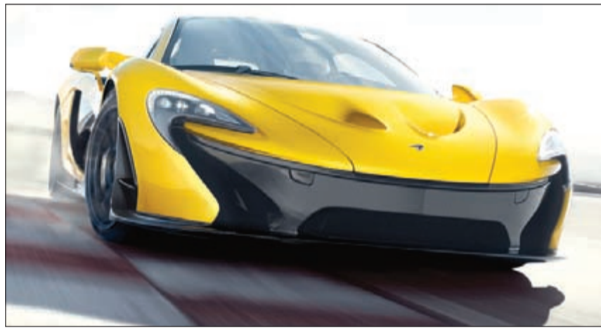
سيارة ماكلاين بي 1

وتم تعزيز المحرك الوسطي نوع V8 ذي الشاحن التوربيني التوامي وسعة 3,8 ليترات بشكل أساسي عبر تزويده بشواحن توربينية أكبر، مع وجود مولد كهربائي عالي الفعالية لتوفير قوة مجمعة تبلغ 903 حصنة وعزمًا أقصى قدره 900 نيوتن-متر.