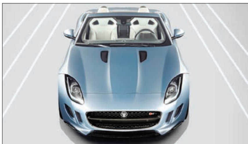
نمو قياسي لمبيعات جاكوار في الشرق الأوسط وشمال أفريقيا