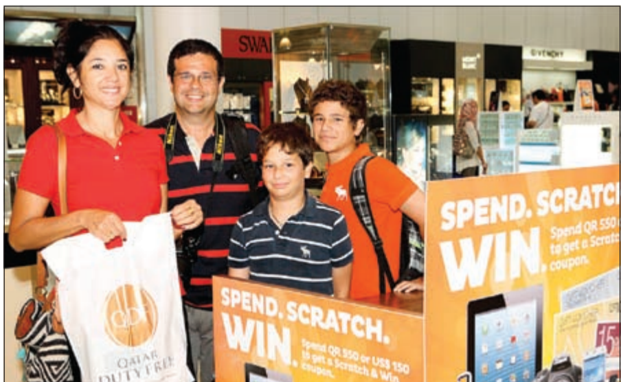
جانب من تسليم الجوائز للفائزين

مستجدات البضائع من مختلف الأنواع بما فيها مستحضرات التجميل، الإلكترونيات، ملابس، ذهب، حلويات وأكثر. وبهذه المناسبة، أشاد الرئيس التنفيذي للخطوط الجوية القطرية أكبر الباكر بالجهود المبذولة في السوق الحرة قطر لتوفير عروض مذهلة للمسافرين عن طريق مطار الدوحة الدولي، مضيفاً: «نحن نعمل بشكل متواصل لإتاحة تجربة سفر فريدة لجميع مسافريننا، وكلنا نثق بأن تكون السوق الحرة قطر هي السوق المفضلة لهم». وتابع قائلاً: «لقد تمت تسمية السوق الحرة قطر كأفضل سوق حرة لهذه السنة في حفل جوائز السوق الحرة والذي أقيم في لندن».