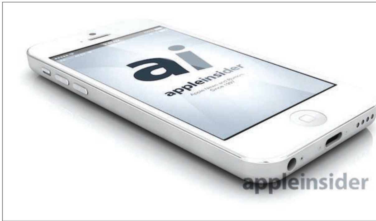
شكل تصوري لآيفون الجديد وفق ما نشره موقع «آبل انسايدر»

نيويورك - د.ب.أ: ذكرت تقارير إخبارية أمس أن شركة آبل الأميركية ستكشف عن هاتف آيفون الجديد في العاشر من سبتمبر المقبل. ونقلت مدونة أول تينجنز