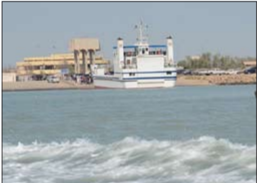
المخالفون والموقوفون نقلوا إلى مخافر العاصمة

تحت إشراف وكيل وزارة الداخلية المساعد لشؤون الأمن العام اللواء محمود الدوسري وبمشاركة مدير عام مديرية أمن محافظة العاصمة اللواء طارق حمادة، قام قطاع الأمن العام بشن حملة أمنية مفاجئة خلال عطلة عيد الفطر السعيد على جزيرة فيلكا لضبط المخالفين والمستهترين، وأسفرت تلك الحملة الأمنية عن ضبط عدد 15 مركبة مخالفة بسبب الرعونة والاستهتار ومخالفات مرورية أخرى وبقايات وعدد من الأشخاص المستهترين ومخالفتي قانون المرور، كما تم إسعاف مصاب نتيجة سقوطه من أحد البانشيات، تأتي تلك الحملة في سياق عدة حملات بهدف القضاء على جميع الظواهر السلبية، لتؤكد أن وزارة الداخلية عازمة على المضي قدما في شن الحملات الأمنية لمواجهة المخالفين للقوانين والمشتبه بهم وتخليص المجتمع من كل أشكال الجريمة وضبط المظالمين واللعنة وفق الخطط والبرامج المعدة للحفاظ على أمن المجتمع واستقراره، مؤكدة على استمرار الحملات الأمنية المفاجئة لتعقب وملاحقة وضبط المخالفين والمظالمين في جميع المناطق.