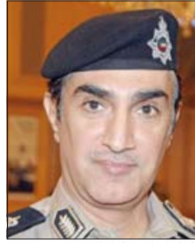
اللواء إبراهيم الطراح

وأضاف المبلغ انه توقف لتقديم المساعدة، وخلال تفحصه لمركبة الشخص الذي توقف له فوجئ بمركبة نوع يكون بها 3 أشخاص تتوقف خلف المركبة التي توقف لمساعدة صاحبها، مشيرا الى انه وفي غضون ثوان تحرك الأشخاص الثلاثة اثنان منهم كانا يحملان سواطير وهداه بالذبح ما لم يسلمهما ما بحوزته من مبالغ مالية. واستطرد المبلغ بالقول: فوجئت بالشخص الذي أقدم له المساعدة يسارع الى سيارتي ويسرق منها مبلغ