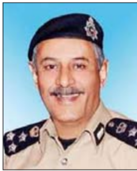
العميد زهير النصرالله

تمكّن رجال أمن شرطة نجدة محافظة حولي من ضبط شخص بحوزته 842 حبة مخدرة حيث تمت إحالته والمضبوطات الى جهة الاختصاص. وأثنى مدير عام الإدارة العامة للشرطة النجدة العميد زهير النصرالله على جهود رجال أمن شرطة نجدة محافظة حولي والتي تكفلت بضبط أحد تجار السموم الفاسدين مسمن يسعون وراء الثراء السريع.