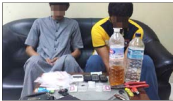
الشابان وامامهما المضبوطات

أخرى، أحال رجال منفذ مطار الكويت مواطنين قداما من دولة خليجية وكانا في حالة غير طبيعية وعثر بحوزتهما على 7 زجاجات خمر مستوردة و10 علب بيرة.