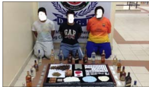
المتهمون الثلاثة في «مقر المكافحة» وامامهم كوكيتل المخدرات

بمسكنه حيث عثر بحوزته على 5 أصابع جاهزه ومهبأة للبيع وسلاح ناري مسدس وذخيرة، وكان برفقته أحد اقاربه وعثر معه أيضا على 50 غراما من مادة الماريغوانا المخدرة وميزان حساس وبالتحقيق معهما